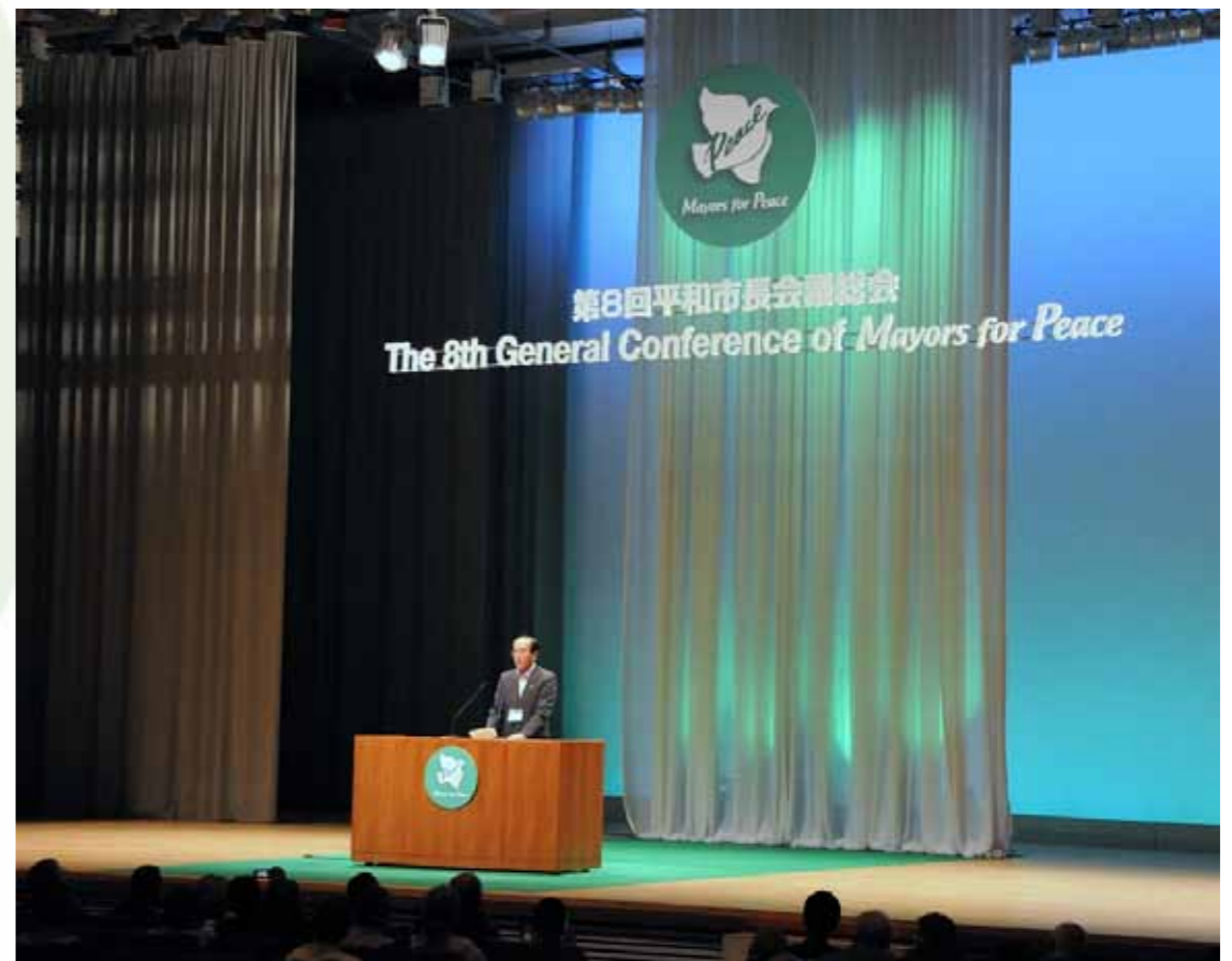
8a Conferència General d'Alcaldes per la Pau (Agost de 2013, Hiroshima)

http://www.mayorsforpeace.org/english/membercity/map.html