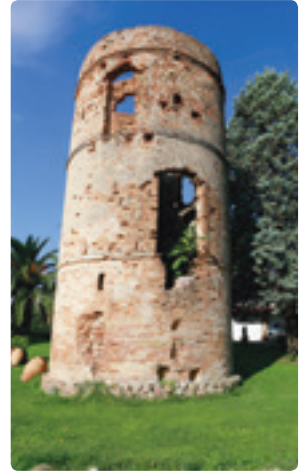
Foto: Torre de Can Casaca.

Matinal per visitar tres torres de telegrafia: torre de Can Bosquerons (Montornès del Vallès), torre de Can Casaca (Granollers) i torre de Puiggraciós (Figaró-Montmany). Es tracta de torres que van servir, a la primera meitat del segle XIX, per a les comunicacions militars entre Barcelona i Vic mitjançant missatges codificats amb un sistema òptic de senyals des d'una torre a l'altra.