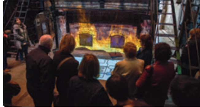
Visita a la Tèrmica.

El fogoner, la feina del qual era controlar el vapor de la caldera, ens farà un recorregut per l'espai de la Tèrmica. La visita a l'anomenat "cor de la fàbrica" ens permetrà descobrir com a partir de carbó, fuel i gas es produïa l'electricitat que necessitava Roca Umbert per funcionar. Tot un repte!