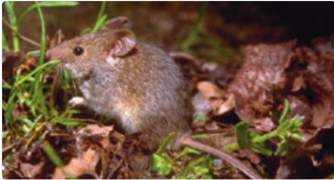
Ratolí de camp mediterrani.

La fauna dels boscos forma part del nostre patrimoni biològic. Els petits mamífers són difícils d'observar, ja que són d'hàbits nocturns o crepusculars. Al taller us ensenyarem com ho fan els investigadors per detectar-ne la presència analitzant les egagròpiles d'òliba. A partir de les peces de les col·leccions del Museu, es classificaran algunes de les espècies de petits mamífers de la comarca.