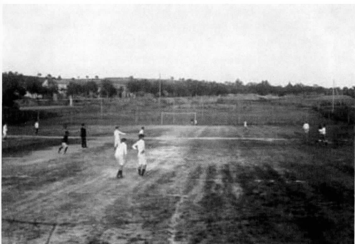
El camp de futbol del Gas, 1913