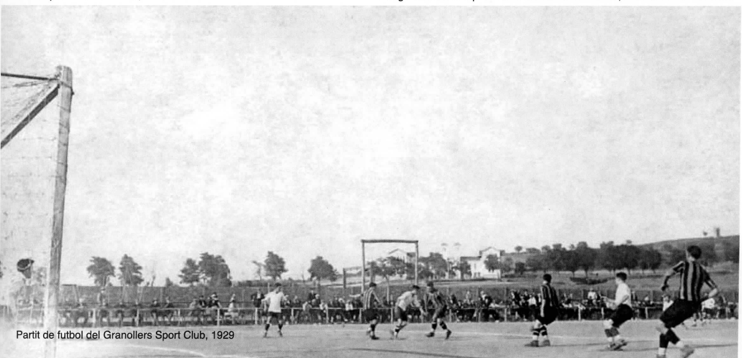
Partit de futbol del Granollers Sport Club, 1929