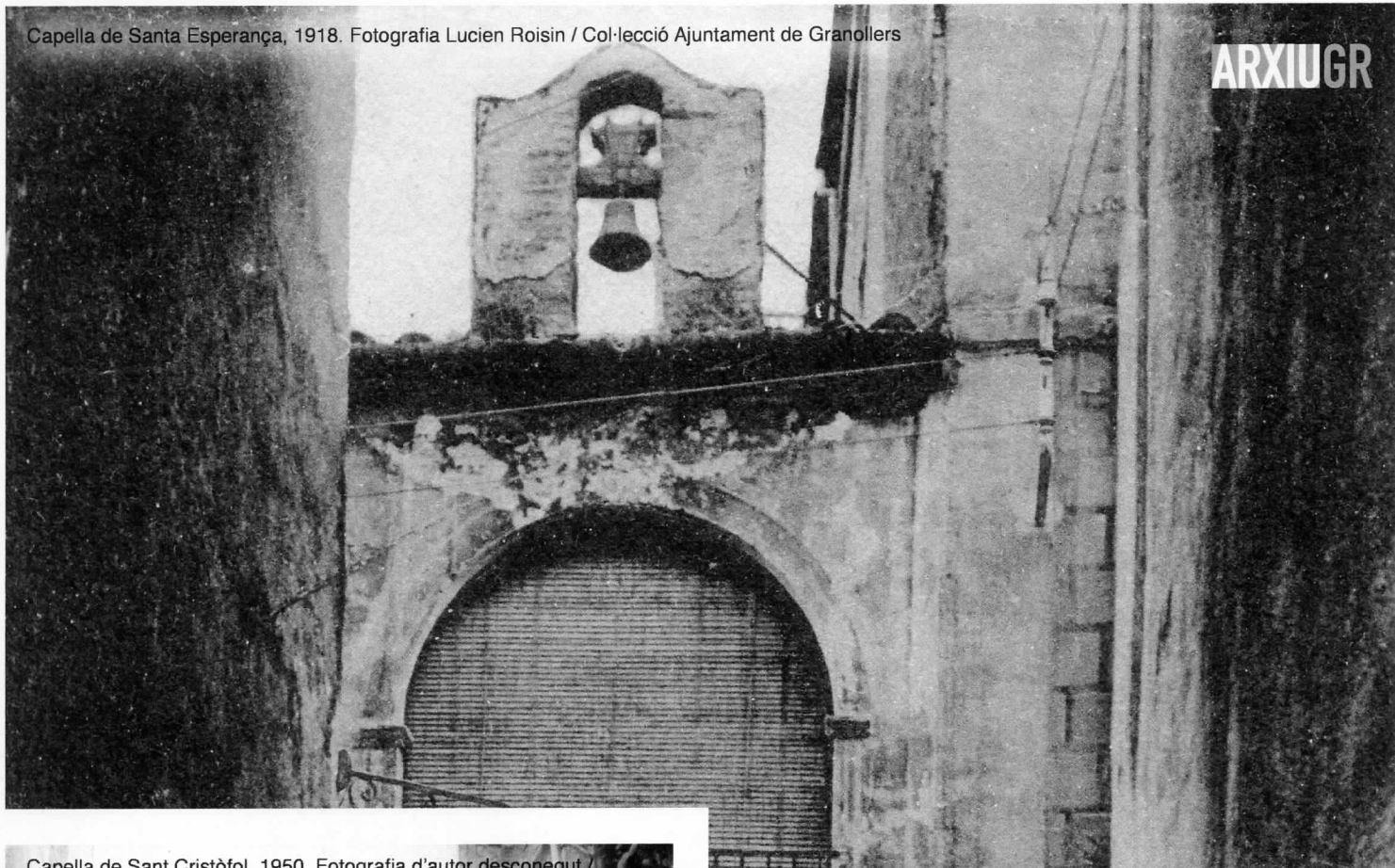
Capella de Santa Esperança, 1918.