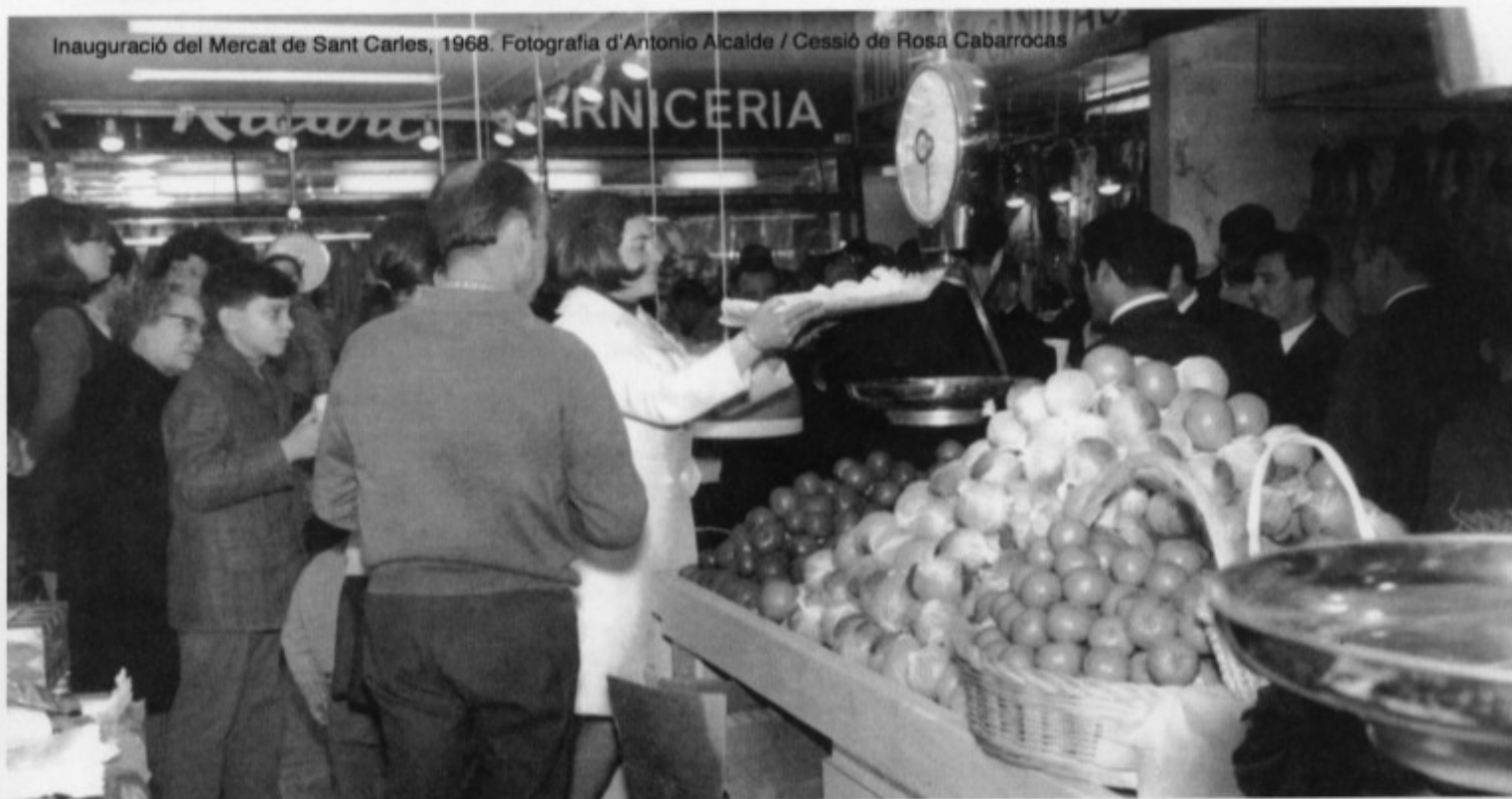
Inauguració del Mercat de Sant Carles, 1968.