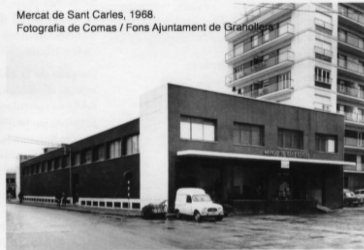
Mercat de Sant Carles, 1968.