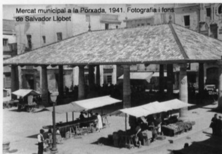
Mercat municipal a la Porxada, 1941. Fotografia i fons de Salvador Llobet