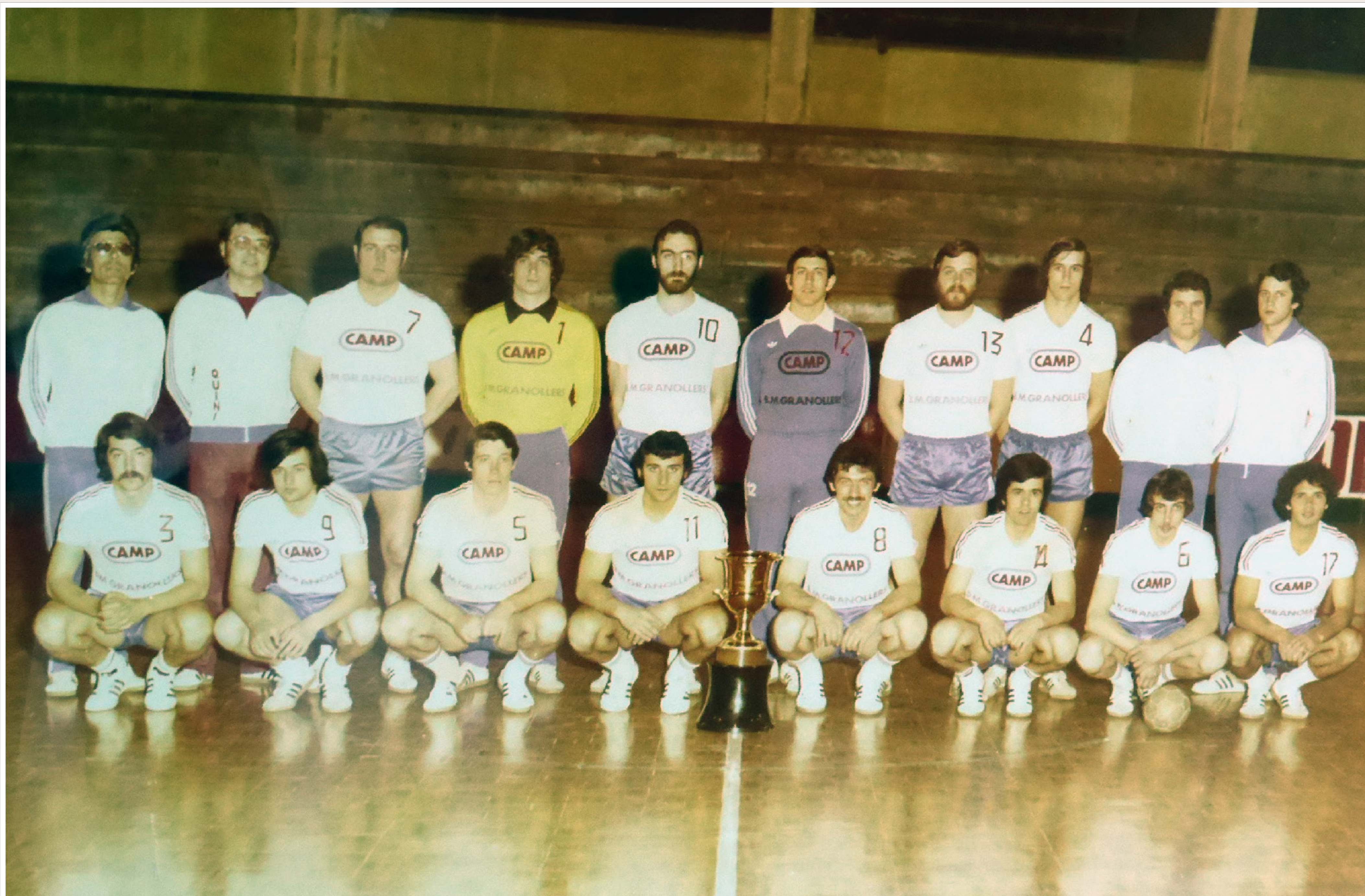
FOTO OFICIAL DEL TÍTOL DE LA RECOPA D'EUROPA DE 1976