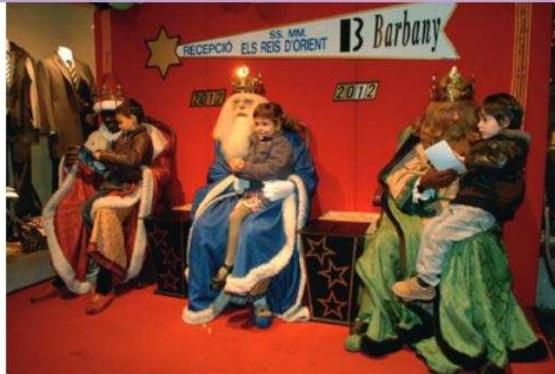
Tres nens entreguen les seves cartes als Reis de Can Barbany, el dia de Cap d'Any de 2012

"Fa un parell de mesos vam decidir que no tornariem a fer els Reis. Som una empresa petita, amb un equip molt reduït, i a banda de la nostra activitat comercial ja portem