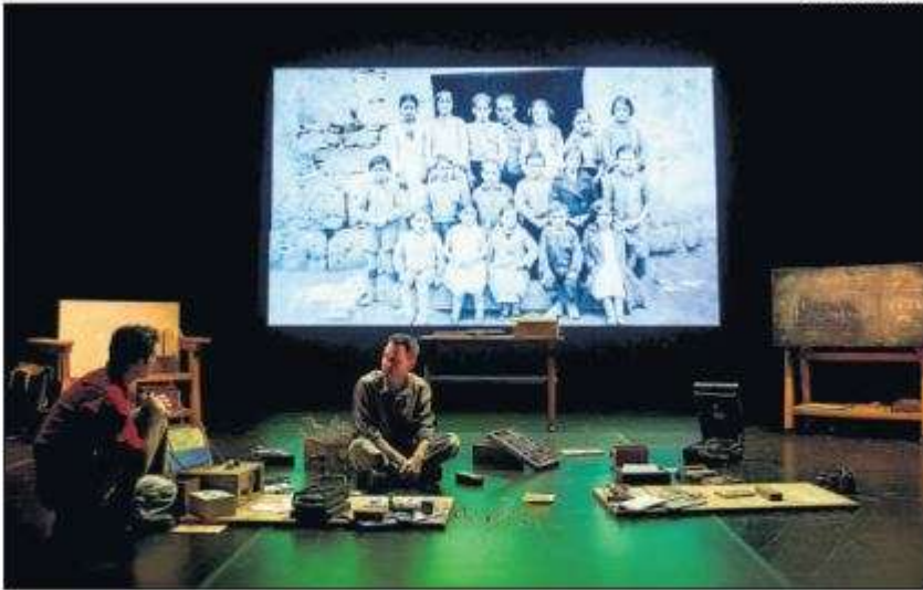
TEATRE 'El mar: visió d'uns nens que no l'han vist mai', dissabte a Bellavista