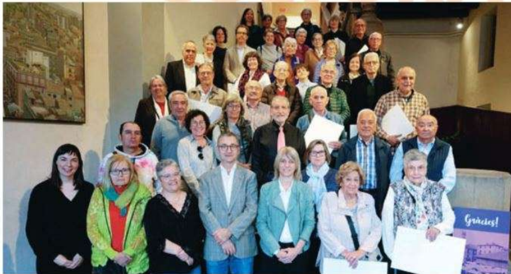
Les persones que van fer les donacions o cessions amb els representants municipals, dijous a l'Ajuntament de Granollers

una cinquantena de positius de finestrals i portals de la ciutat dels anys 1968 o 1969, més de 150 imatges digitalitzades de fauna local del 2017 al 2022 o un positiu de l'edifici de l'Ajuntament en construcció dels anys 1902-1904. A més, hi ha informació relacionada amb esdeveniments històrics com el happening de Salvador Dalí a la Porxada, la Setmana del Cine Español, el Reis de Can Barmany i documents personals. Tota aquesta documentació, que ajudarà a enriquir el patrimoni històric de la ciutat, es posa a disposició pública per ser consultada.