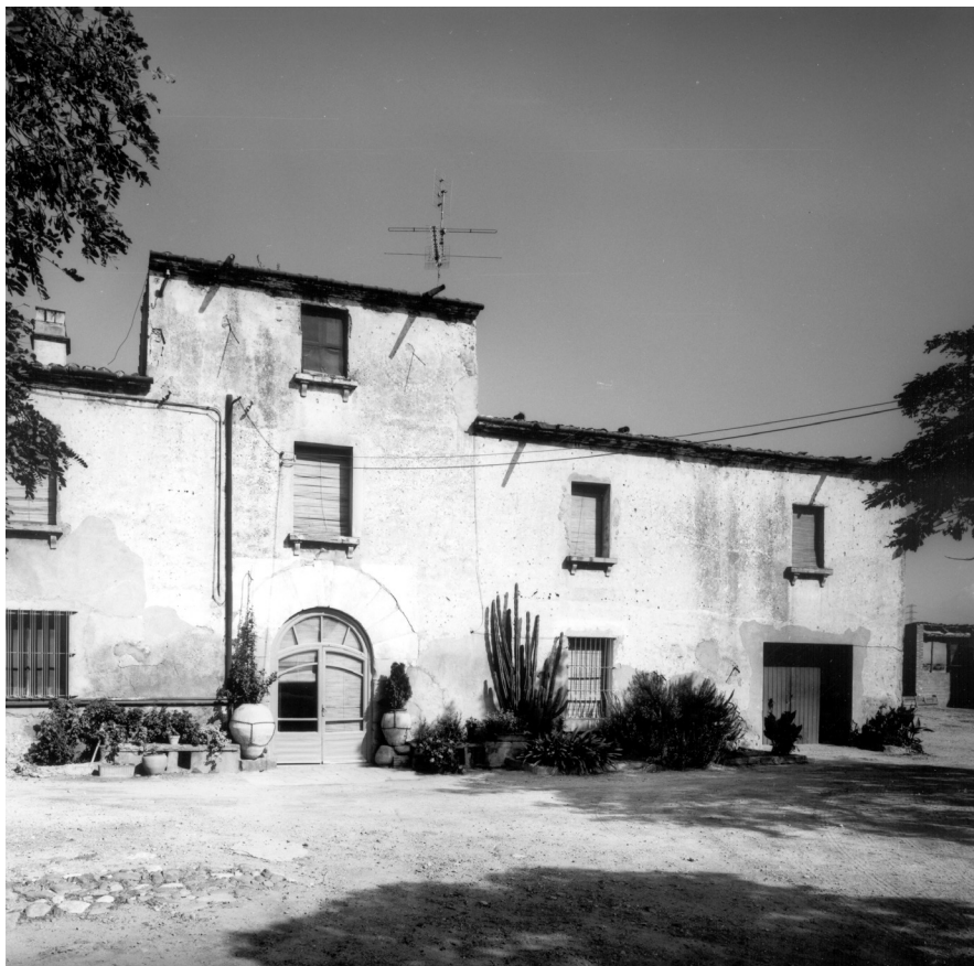
Masia de Can Plantada