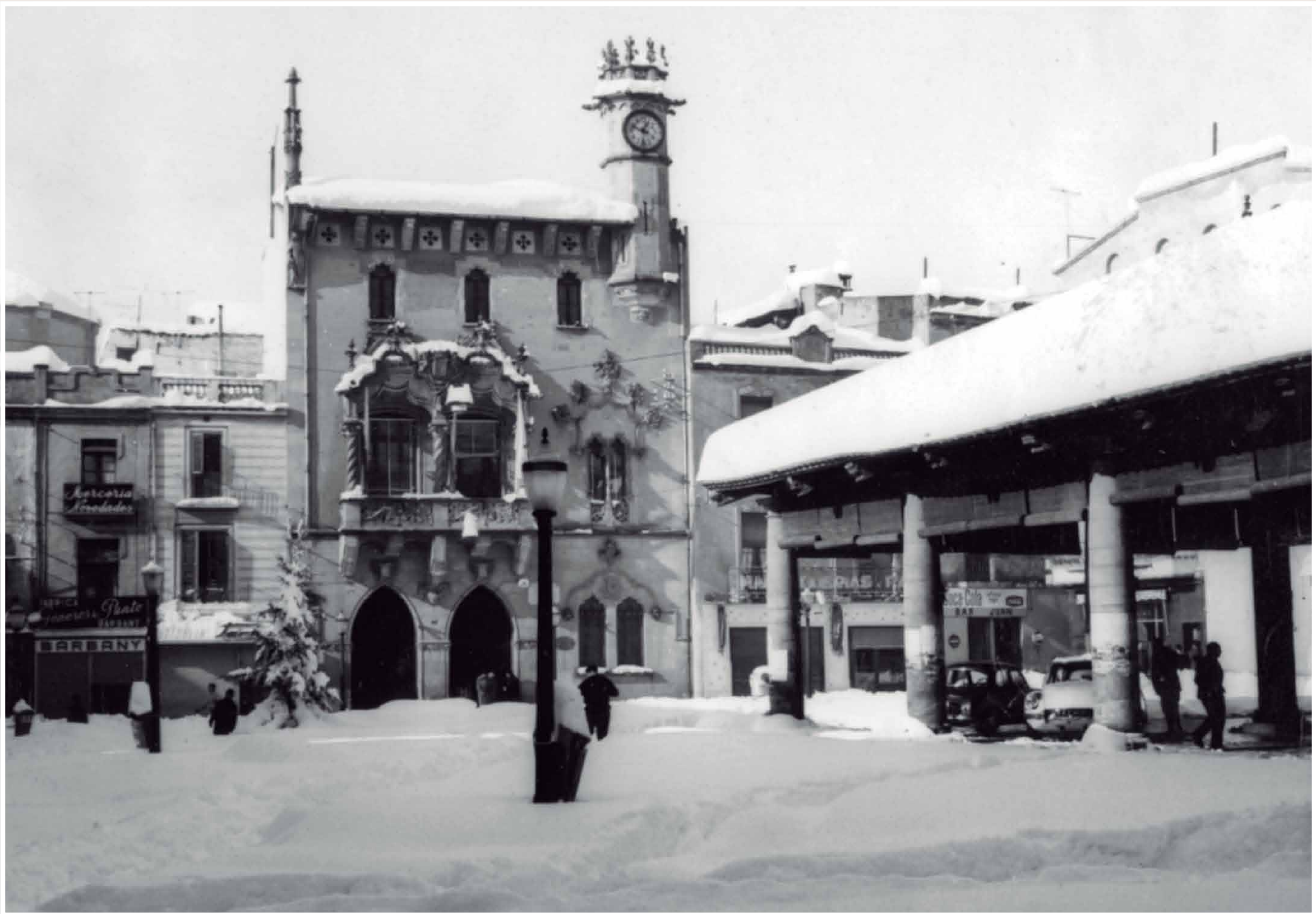
LA PLAÇA DE LA PORXADA L'ENDEMÀ DE LA NEVADA La Porxada va servir de cobert per a alguns cotxes, 26 de desembre de 1962.