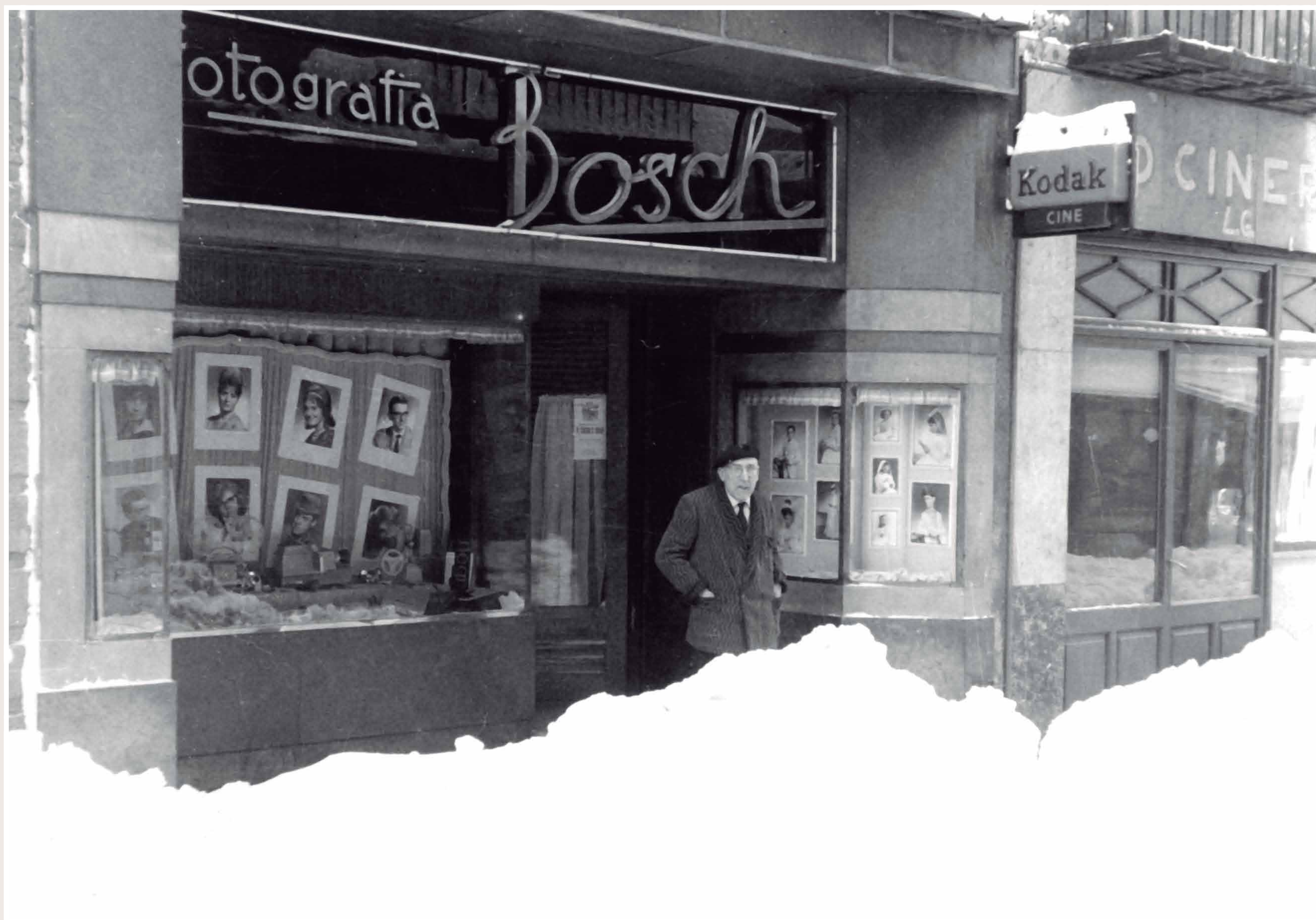
BOTIGA DE FOTOGRAFIA DE CAN BOSCH AL CARRER DE SANT ROC Josep Bosch i Plans davant del seu estudi fotogràfic al carrer de Sant Roc, desembre de 1962.