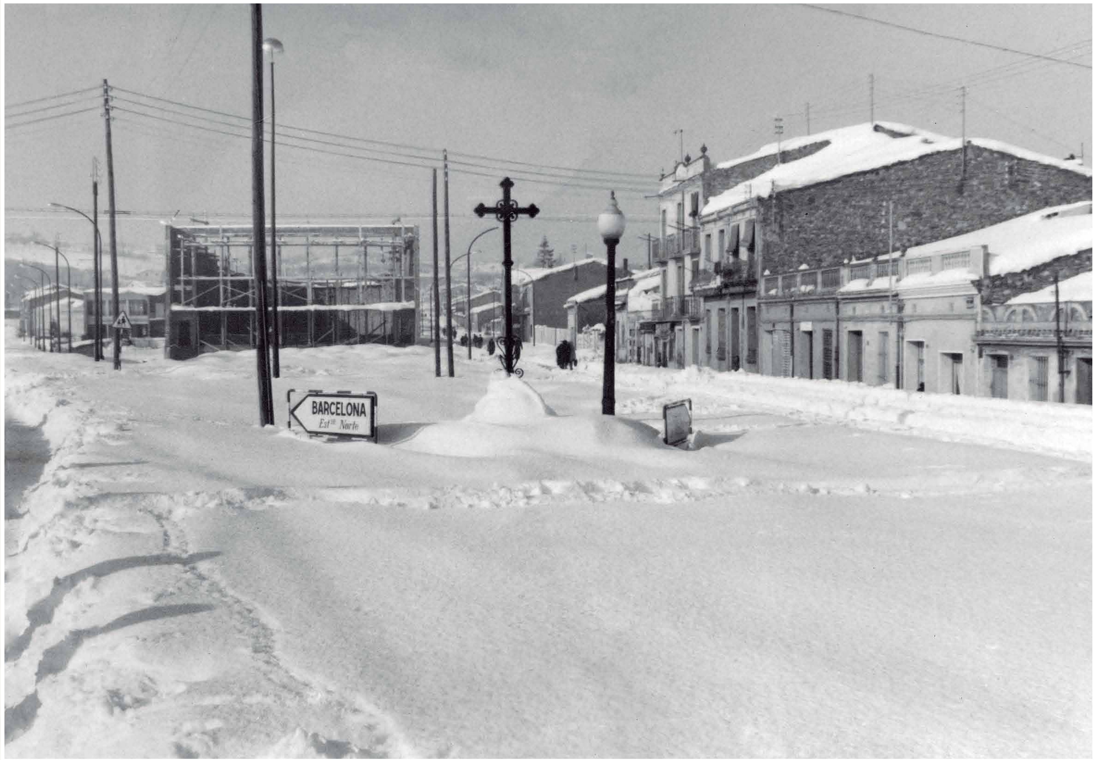
CRUÏLLA DE L' AVINGUDA DE L'ESTACIÓ DEL NORD AMB LA CARRETERA DE CALDES Vista de la cruïlla de l'avinguda de l'Estació del Nord amb la carretera de Caldes. Al centre de la imatge l'Església de Fàtima en construcció, desembre de 1962.