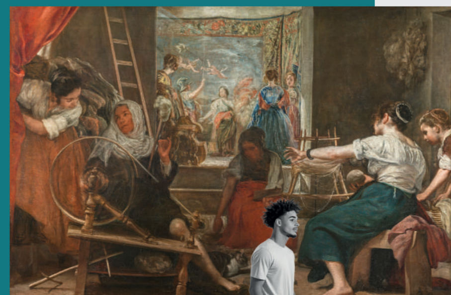
13 Las hilanderas o La fábula de Aracne (c. 1657) Diego Velázquez (1599-1660) Ubicació: plaça dels Recanvis (dins Roca Umbert) Mides: 220 x 289 cm