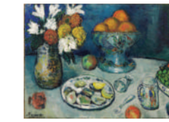
04 Natura morta (1901) Pablo Picasso (1881-1973) Ubicació: c. Sant Jaume, 6 (al costat del Mercat) Mides: 60,5 x 81,5cm