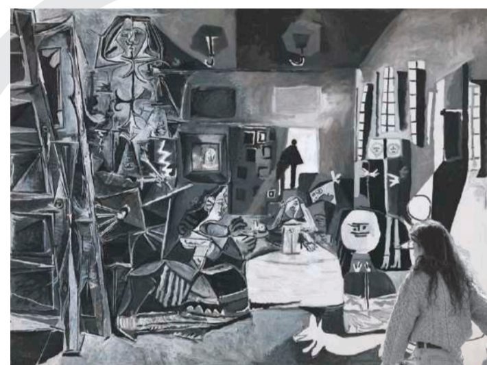
06 Las Meninas (1957) Pablo Picasso (1881-1973) Ubicació: cantonada C. Magallanes / Francesc Macià Mides: 194 x 260 cm