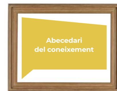
14 L'Abecedari del coneixement Autories diverses de la ciutat "L'Abecedari del Coneixement és un alfabet en construcció format per lletres fetes per agents educatius de la ciutat. Cadascú aporta una part al coneixement col·lectiu." Ubicació: Passeig Fluvial Mides: Diverses