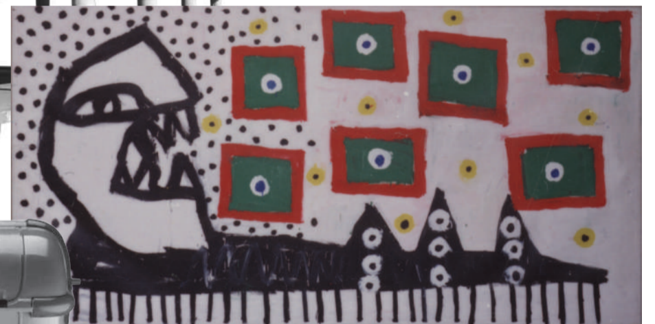
10 Sense títol (1982) Ferran García Sevilla (1949) Ubicació: paret Casino (C. Girona) Mides: 175 x 340 cm