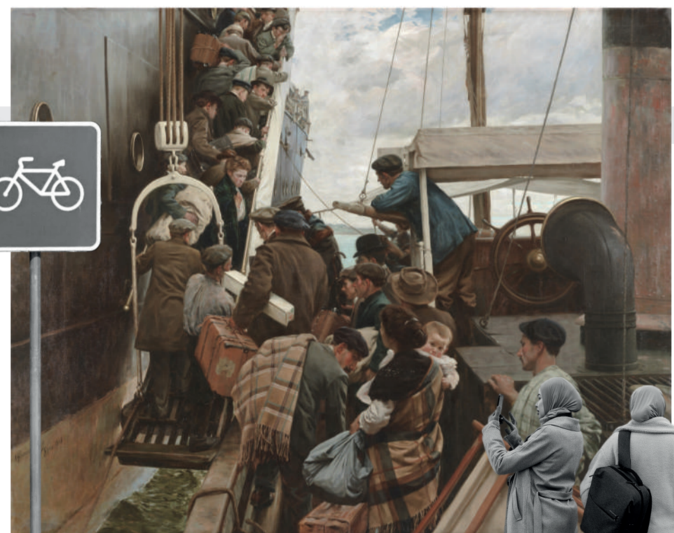
07 Emigrantes (c. 1915-1920) Josep Maria Sert (1874-1945) Ubicació: Centre Cívic Can Bassa Mides: 280,5 x 352,5 cm