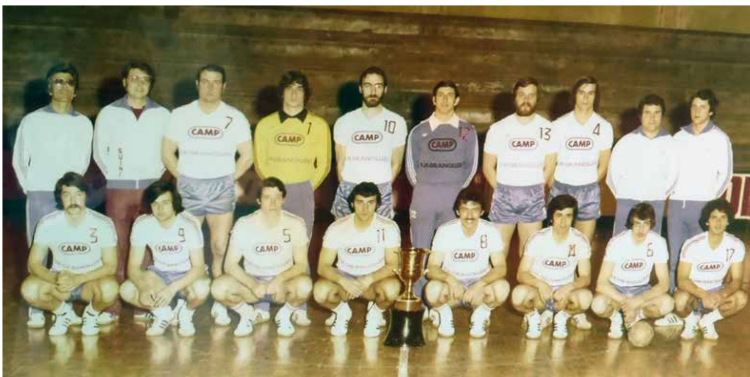
Foto oficial del títol de la Recopa d'Europa de 1976.