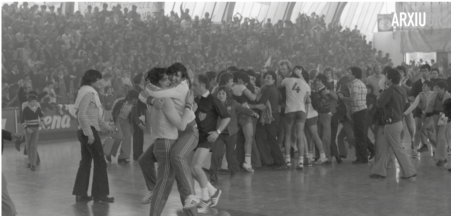
Final del partit de semifinals entre el BM Granollers i l'Oppsal Handball, 19 de març de 1976.