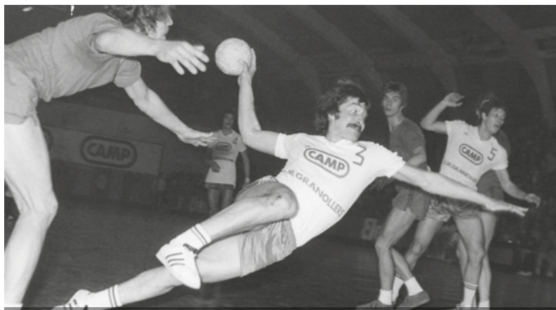
Final de la Recopa d'Europa entre el BM Granollers i el Gruen-Weiss Dankersen, 10 d'abril de 1976.