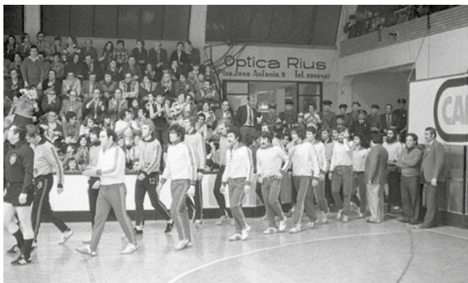
Final de la Recopa d'Europa entre el BM Granollers i el Gruen-Weiss Dankersen, 10 d'abril de 1976.