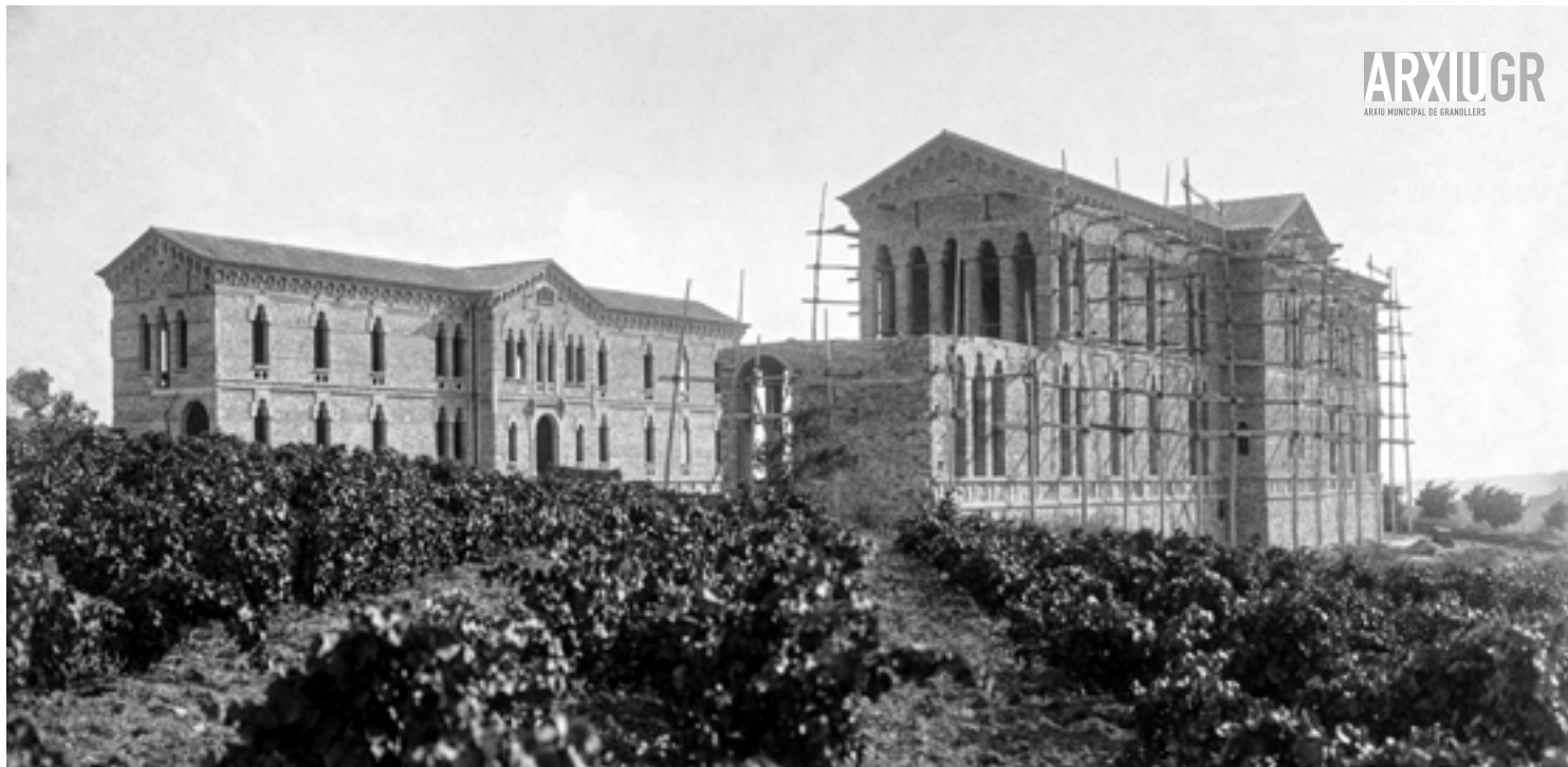
Construcció dels principals pavellons de l'Hospital-Asil, 1916-1918.