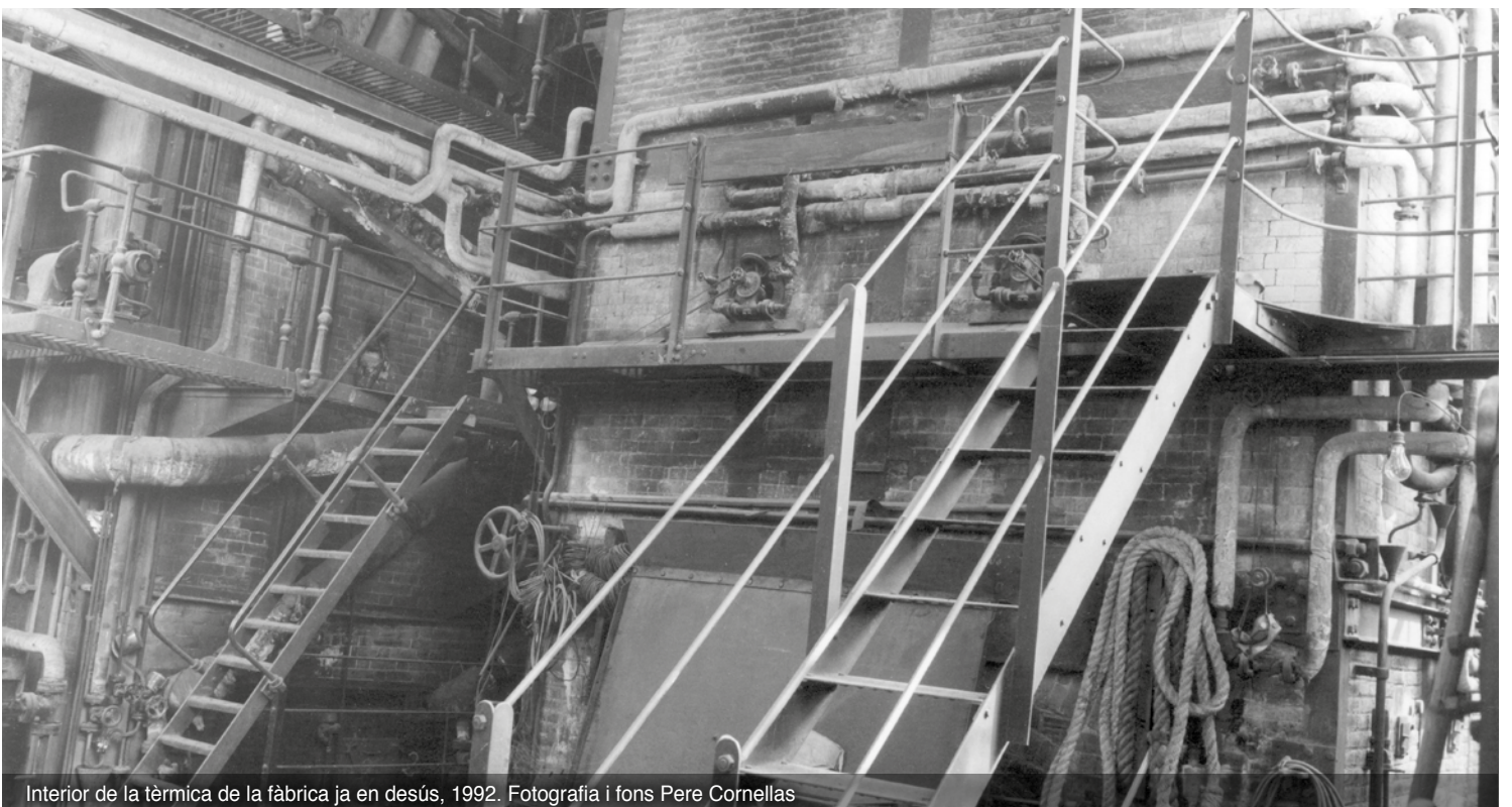
Interior de la tèrmica de la fàbrica ja en desús, 1992.