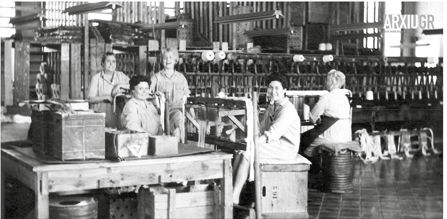
Treballadores a la nau de la filatura, anys setanta.