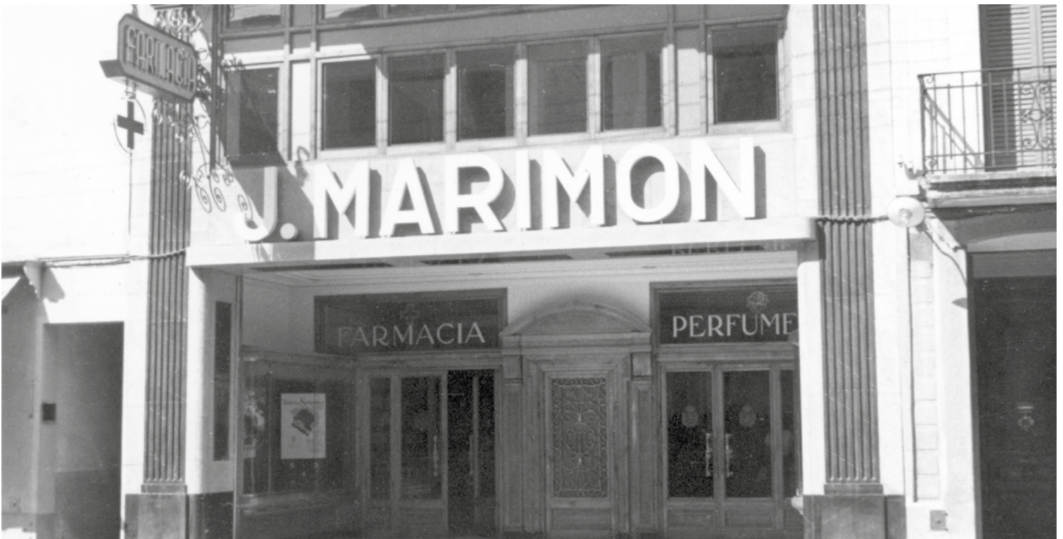
Farmàcia Marimon al carrer d'Anselm Clavé, anys cinquanta.