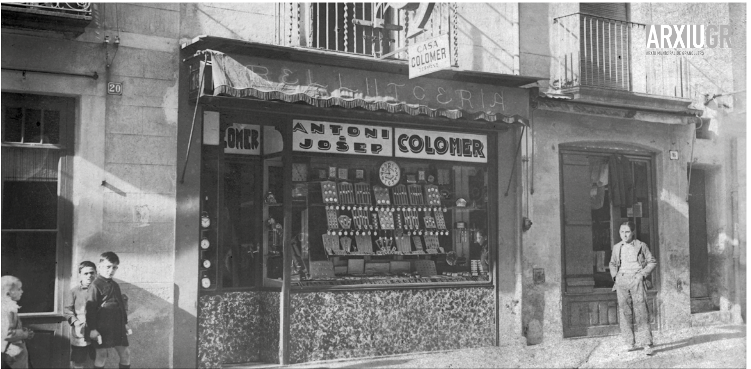
Relotgeria dels germans Antoni i Josep Colomer Canals al carrer de Josep Anselm Clavé, 1935.