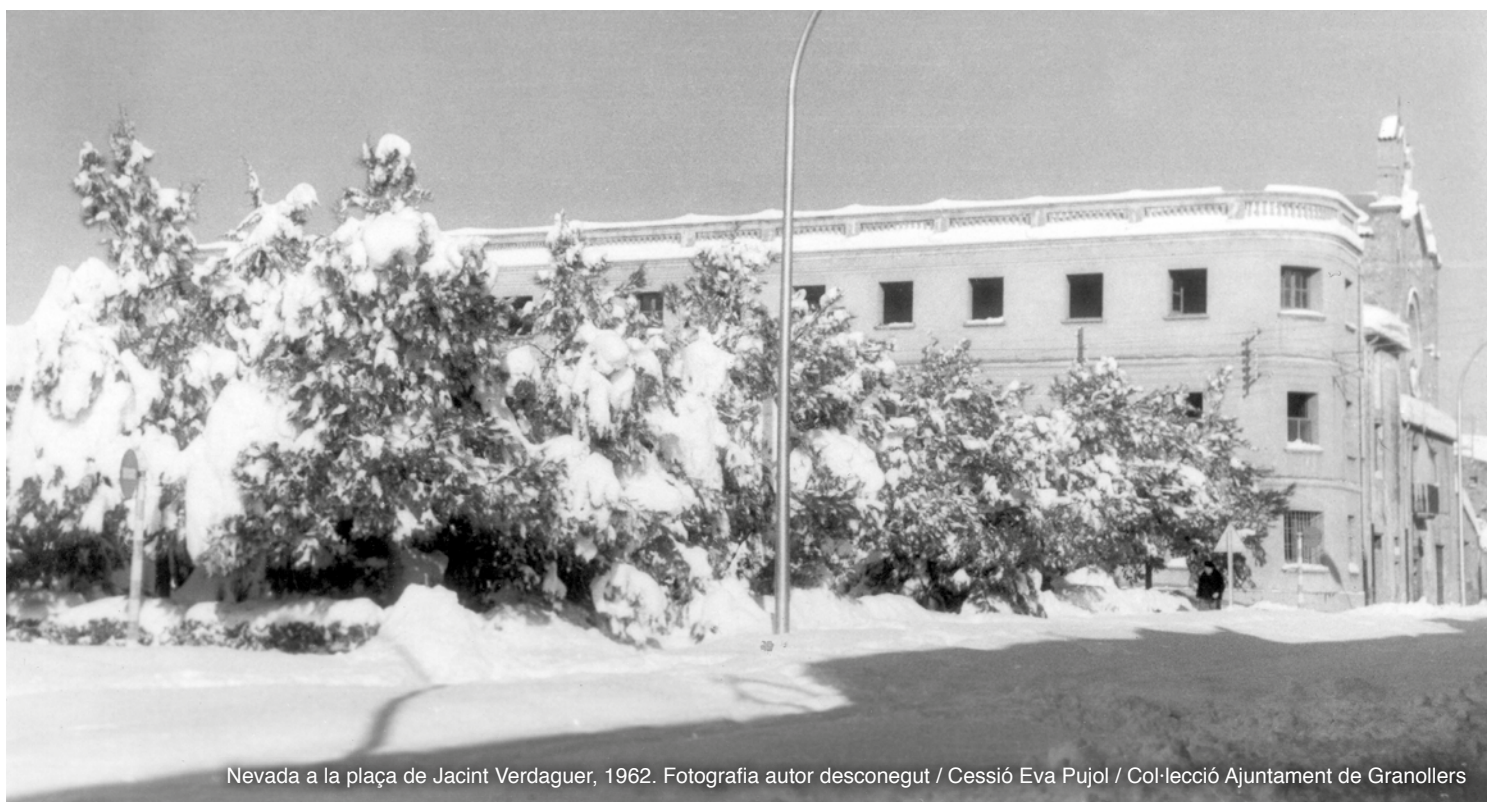
Nevada a la plaça de Jacint Verdaguer, 1962.