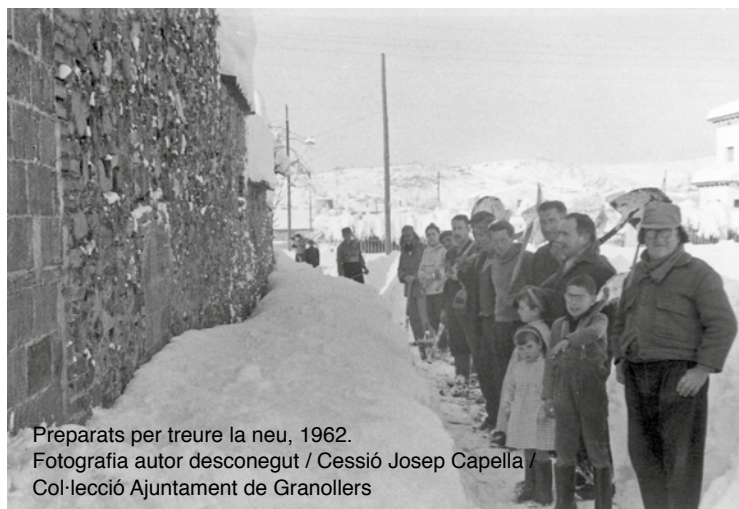
Preparats per treure la neu, 1962.