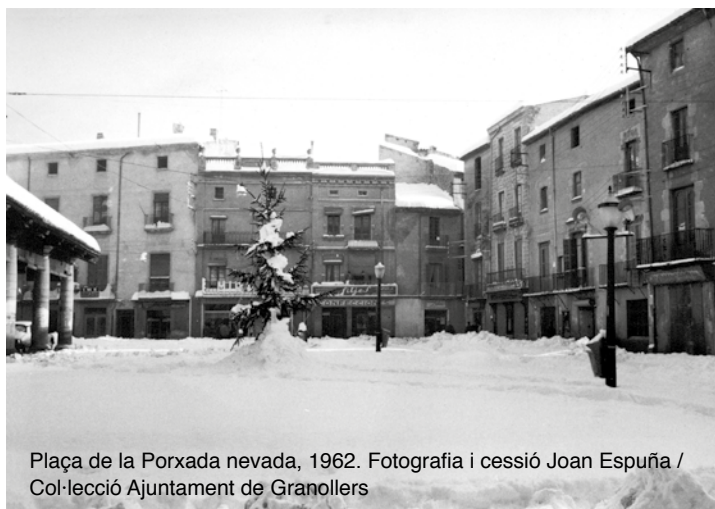
Plaça de la Porxada nevada, 1962.