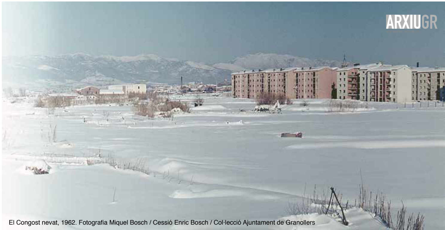
El Congost nevat, 1962.