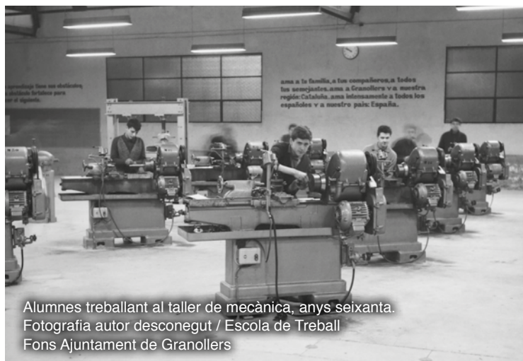
Alumnes treballant al taller de mecànica, anys seixanta.