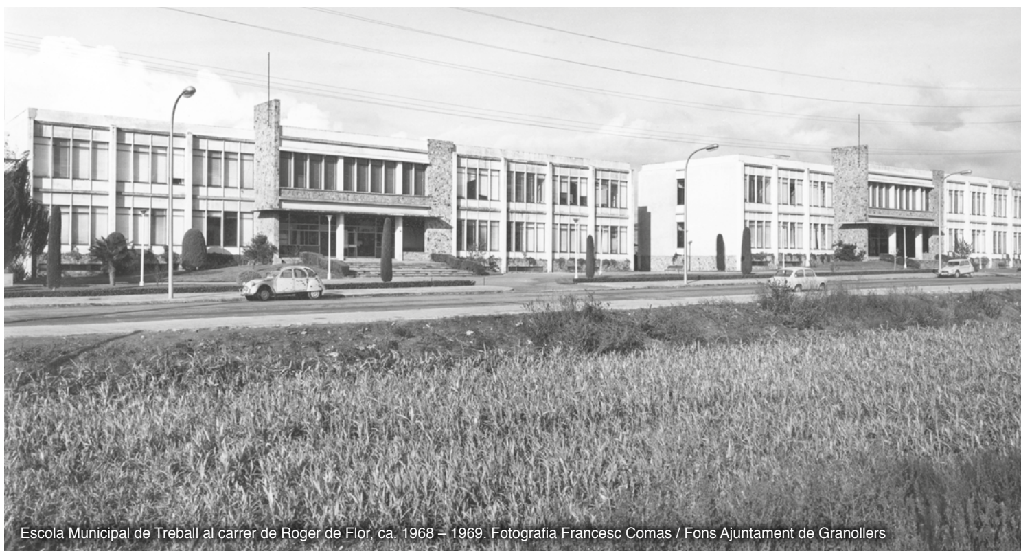
Escola Municipal de Treball al carrer de Roger de Flor, ca. 1968 - 1969.