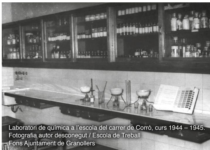
Laboratori de química a l'escola del carrer de Corró, curs 1944 - 1945.