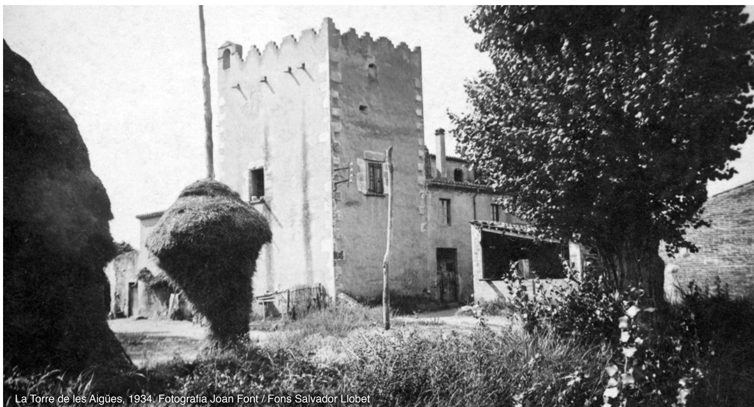
La Torre de les Aigües, 1934.