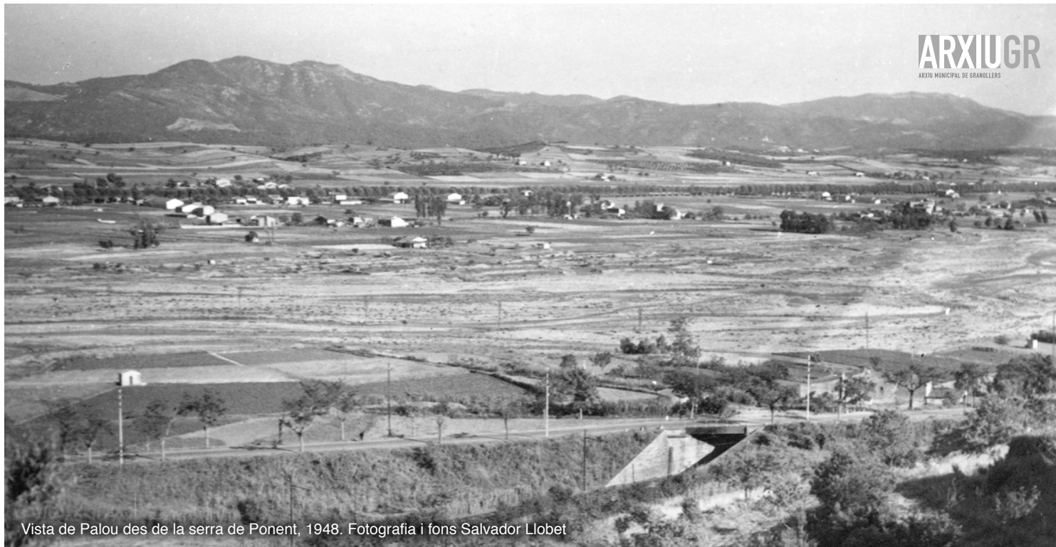
Vista de Palou des de la serra de Ponent, 1948.