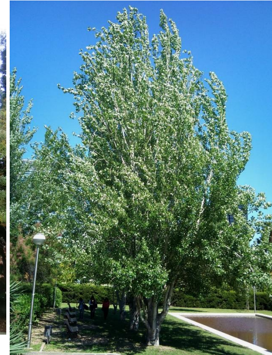
ÀLBER Populus alba