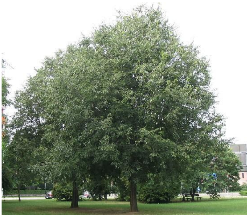
LLEDONER Celtis australis