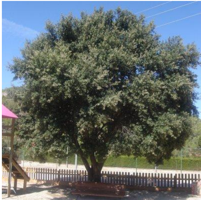
ALZINA Quercus ilex