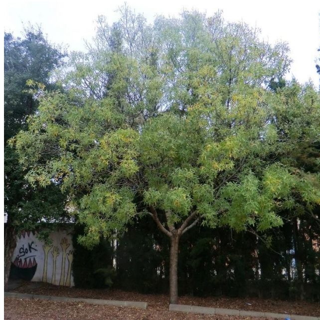
FREIXE Fraxinus angustifolia