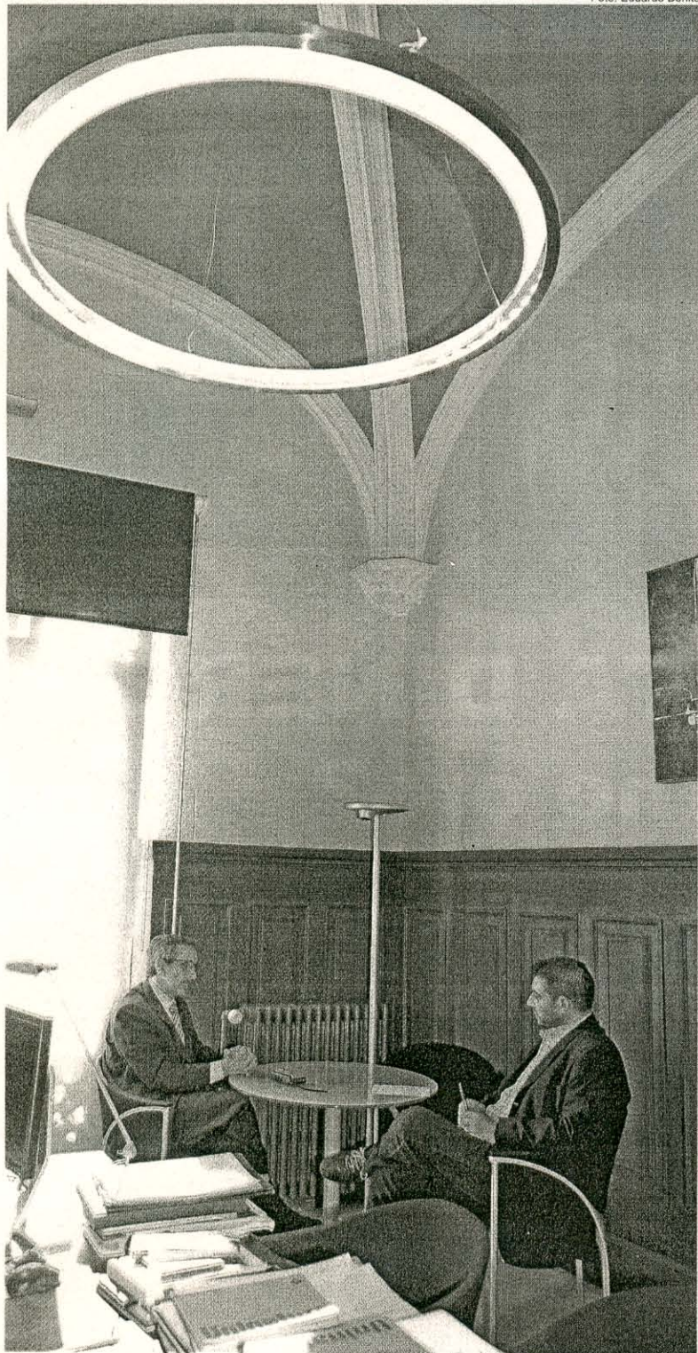
Dues fotografies dels bitllets falsos incautats a la banda.