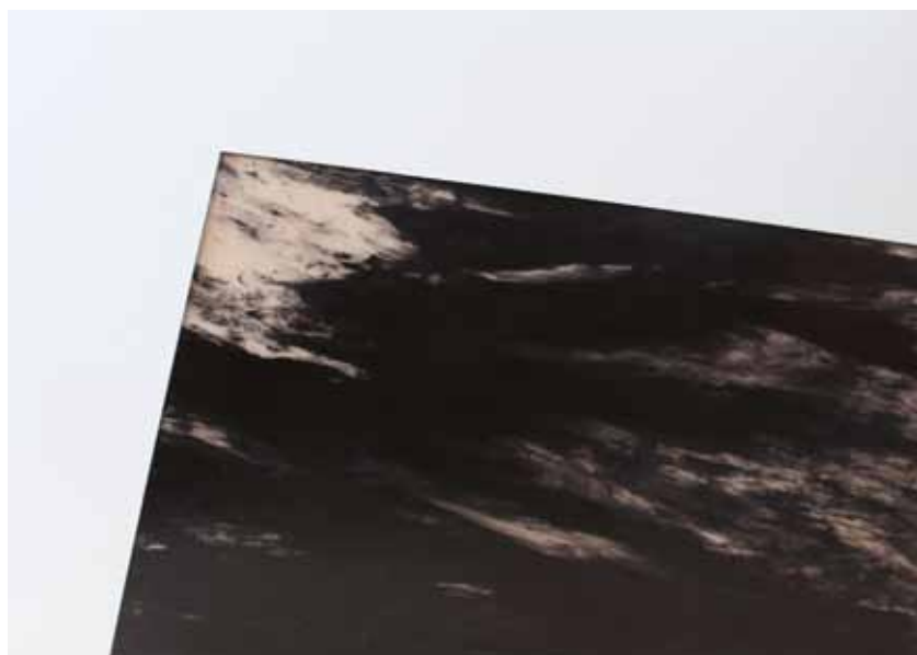
Ramon Aumedes Natural , 2013 Sèrie de 18 obres 4 obres de polièster líquid sobre fòrmica, de 170 x 116 cm 14 obres de tècnica mixta sobre metacrilat, de 170 x 116 cm