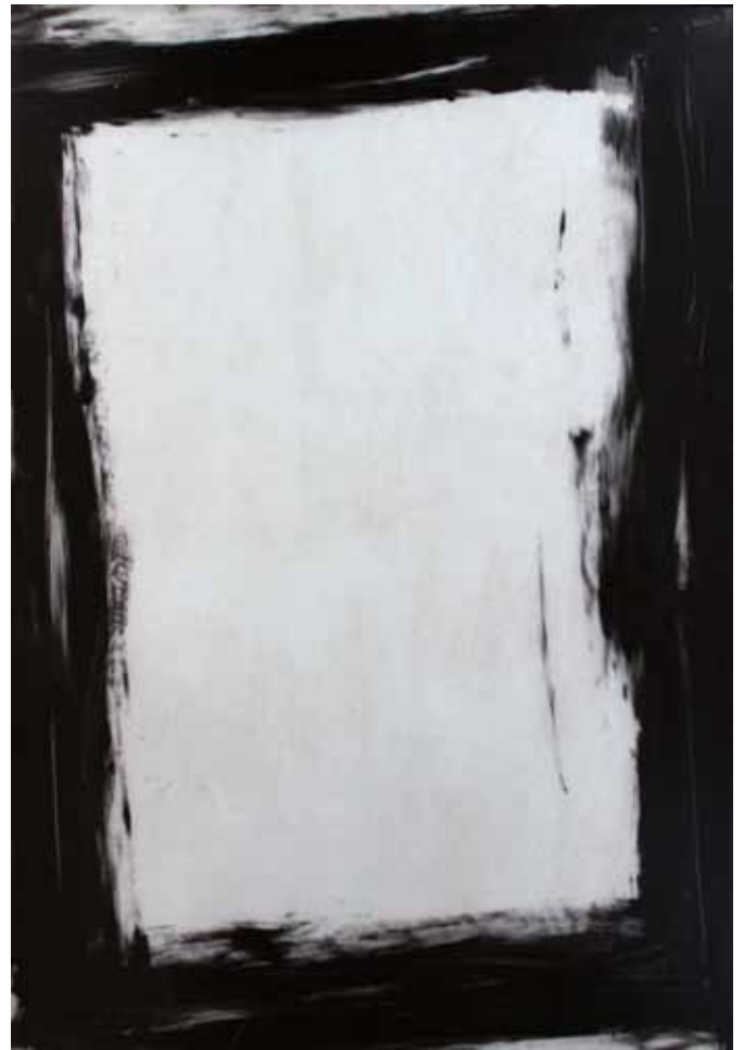
Detalls de la sèrie Ramon Aumedes Social, 2013 Sèrie de 12 obres Polièster líquid i fibra de vidre 170 x 116 cm

Tres espais ens obren tres línies de pensament. Tot viatge té un punt d'inici i aquest ho vol fer des de la senzillesa i l'obvietat de la realitat. Mirant i escorcollant unes peces que parlen de la pedra. La natura i un dels seus objectes, inanimats, freds, aparentment estèrils, que ha donat una veu potent als homes des del naixement de l'escultura. N'és condicionant. Tot el que ha rebut, ha vist d'allò que l'envoltava, ha fet servir per fer-se sentir. Una veu capaç de potenciar el missatge i fer-lo, fins i tot, comprensible per a si mateix. Una veu que ens ha permès comprendre les formes des del punt de vista, no de l'observador, sinó de l'acció, transformant-les en el nostre reflex.