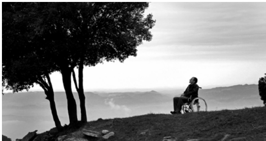
El Quimi Portet es mou