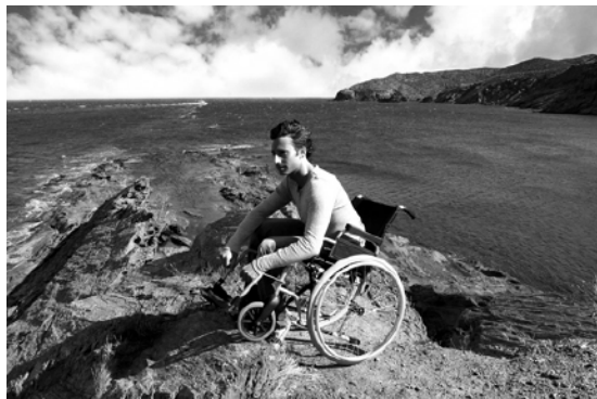
El Bruno Oro es mou