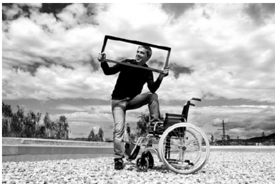
L'Albert Om es mou