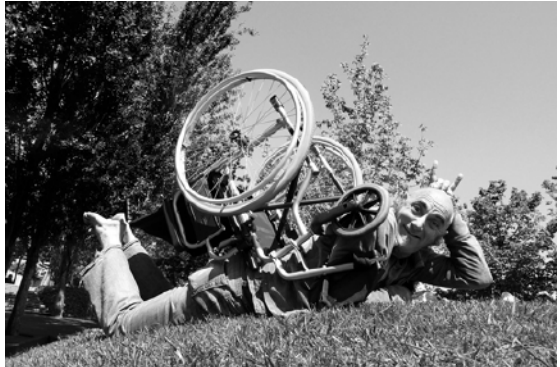
El Pau Riba es mou