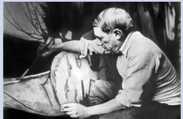
Dora Maar, Picasso treballant en el Guernica al taller de Grands-Agustins, 1937, París

L'ADOBERIA. Centre d'interpretació històrica del Granollers medieval Apunts de Granollers. Dibuixos d'Ermengol Vinaixa i Gaig