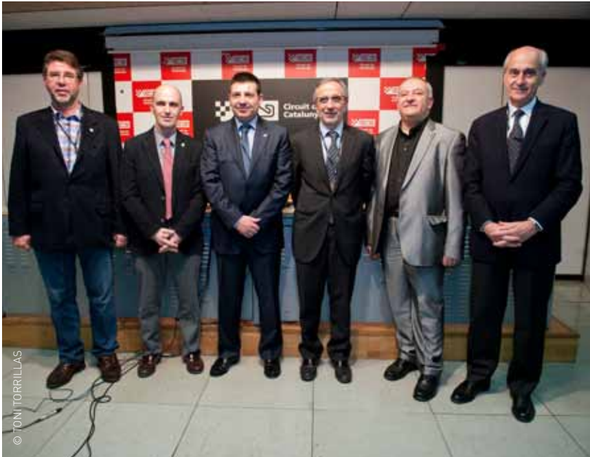
El director del Circuit, els alcaldes de Parets del Vallès, Montmeló, Granollers i els presidents del Consell Comarcal i del Circuit

Aprofitar l'oportunitat econòmica i social que ofereix el Circuit de Catalunya és un dels objectius principals que s'han marcat els municipis de Parets del Vallès, Granollers i Montmeló, juntament amb el Consell Comarcal del Vallès Oriental, a l'hora de crear l'Associació de Municipis Parc Territorial del Circuit. Aquesta entitat treballarà conjuntament amb empresaris, restauradors, associacions, sindicats, indústria i d'altres ens implicats per dissenyar una estratègia que generi beneficis en l'àmbit esportiu, social i econòmic als municipis que envolten l'equipament. Els tres consistoris coordinaran i impulsaran les actuacions d'abast municipal en l'àmbit territorial del Circuit com ara l'estudi urbanístic del sector, la recerca de sistemes per a la creació de noves oportunitats o l'impuls dels consells de participació sectorial. Així els membres de l'Associació de Municipis Parc Territorial del Circuit portaran a terme l'anàlisi urbanística de l'àrea i la detecció de les potencialitats de l'entorn com noves oportunitats econòmiques, esportives, culturals, hoteleres, d'infraestructures, paisatgístiques o ambientals. I, la coordinació dels planejaments municipals sobre el Circuit i l'entorn amb un marc d'ordenació amb criteris homogenis i coherents.