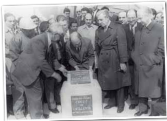
COL·LOCACIÓ DE LA PRIMERA PEDRA DEL CIRCUIT DE CATALUNYA, 24 DE FEBRER DE 1989