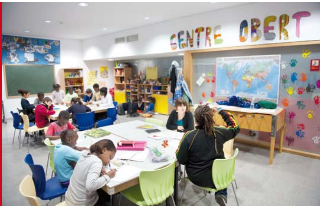
Activitat en el Centre Obert Nord, ubicat al Centre Cívic Nord (c. Lledoner, 6)

L'aplicació de les lleis de serveis socials i de persones en situació de dependència, juntament amb la crisi econòmica, ha comportat que l'Ajuntament dediqui més recursos als serveis socials municipals. Als serveis que està obligat a prestar per llei, l'Ajuntament n'hi ha afegit d'altres de caràcter preventiu, sempre amb l'objectiu que siguin accessibles a tothom i de qualitat. Tots ells són guiats pels professionals dels equips d'atenció primària que donen informació sobre els mitjans existents i ajuden a resoldre o a orientar millor les problemàtiques plantejades.