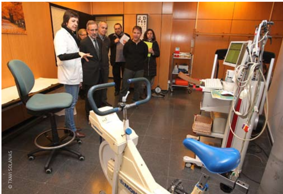
Visita al Centre de Medicina de l'Esport

Granollers té 59 clubs esportius i 22 instal·lacions on practicar les 40 modalitats esportives que