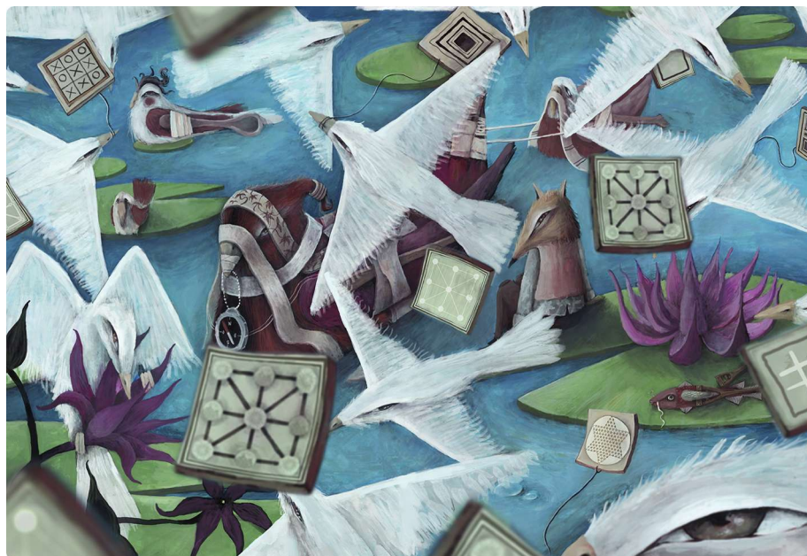
Enric Lax. Nenúfars, 2013. Gouache sobre paper i retoc digital. 42 x 52 cm