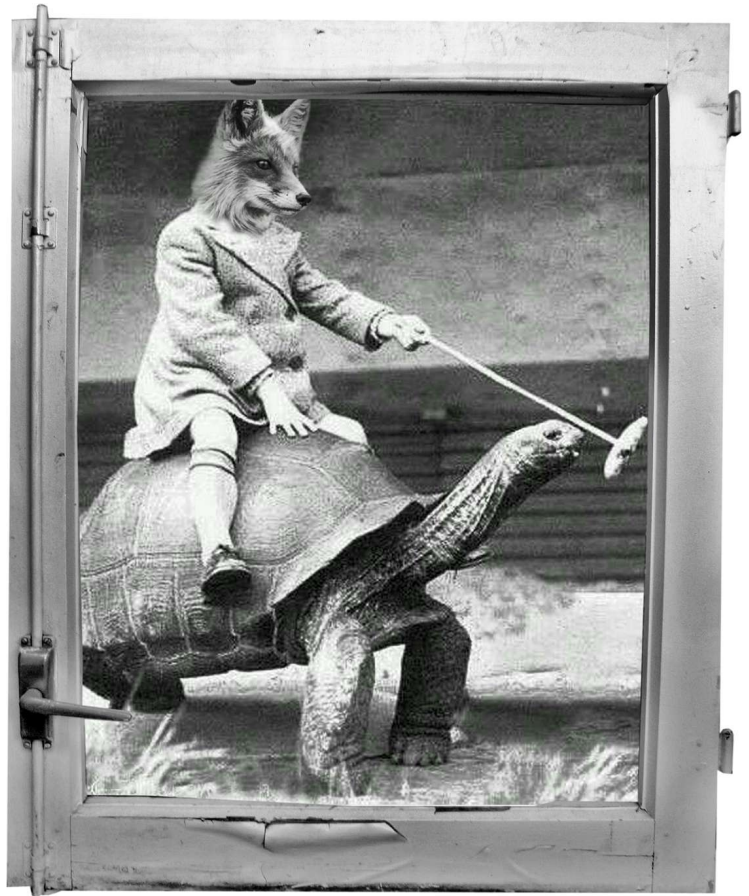
Josu Oliva Far away from California , 2013 Revista F*cking Young online 70 x 50 cm