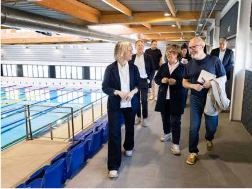
Presentació de la reforma de les piscines municipals i recorregut per les noves instal·lacions