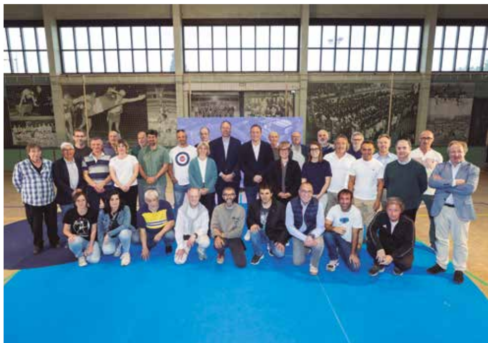
Presentació del pla d'inversió municipal i el Pla de joc de la Generalitat per a la millora de les instal·lacions esportives, el passat 20 d'abril

En l'àmbit de la sostenibilitat, s'invertiran 420.000 euros per fer instal·lacions més eficients, com el nou sistema d'autogestió dels serveis del Palau d'Esports. Pel que fa a la funcionalitat,