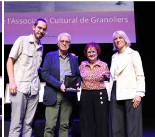
Medalla de la Ciutat al Cineclub de l'Associació Cultural de Granollers (1950)

Es distingeix per la seva contribució al coneixement de la història social i política de Granollers i per la seva dedicació a l'educació i a la difusió del saber.