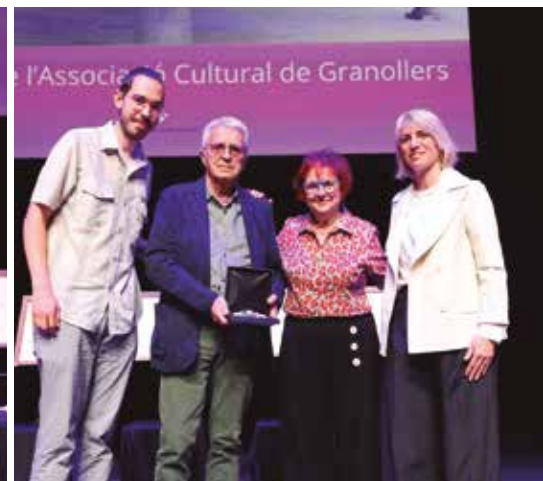
Medalla de la Ciutat al Cineclub de l'Associació Cultural de Granollers (1950)

Es distingeix per la seva contribució al coneixement de la història social i política de Granollers i per la seva dedicació a l'educació i a la difusió del saber.