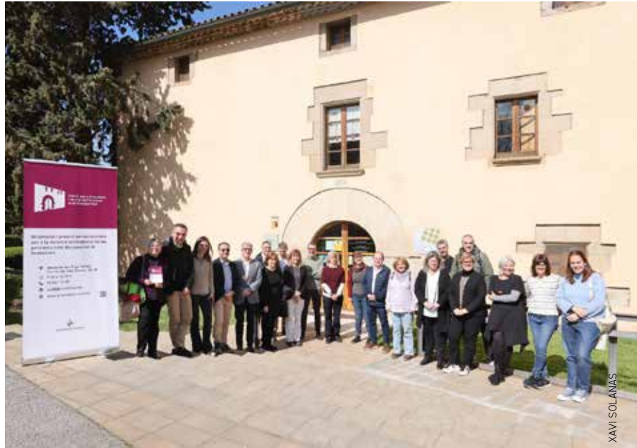
El dia de la presentació a la Masia Tres Torres. El servei compta amb la col·laboració d'Apindep, Viver de Bell-lloc, Fundació Vallès Oriental i Boreal Comunicació Accessible

El nou servei ofereix, a les persones interessades a trobar feina, una anàlisi d'ocupabilitat, un itinerari personalitzat d'inserció laboral, l'acompanyament en la cerca o disseny de cursos de formació, una borsa de treball i un seguiment postinserció. Les persones amb discapacitat tenen encara moltes dificultats per accedir al mercat de treball.