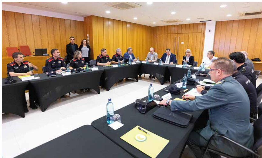
La Junta Local de Seguretat, amb l'assistència del conseller d'Interior, Joan Ignasi Elena, va aprovar el Pla

Granollers disposa des de finals d'octubre del seu primer Pla Local de Seguretat. Aquest document és l'instrument que, en l'àmbit municipal, fa una anàlisi de la situació per establir els objectius