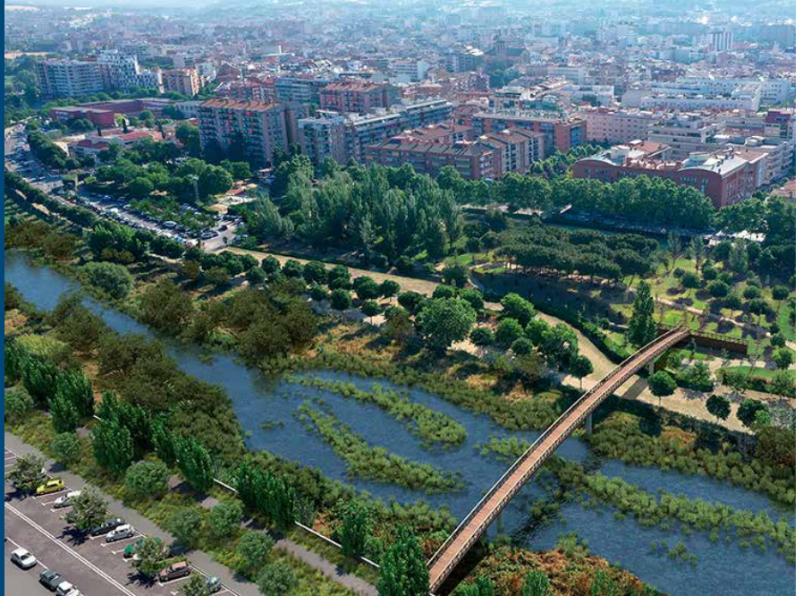
Imatge virtual del resultat del projecte de renaturalització del riu Congost i de la nova passera

El Ple municipal ha aprovat aquest novembre en sessió extraordinària el pressupost general per al 2024 amb els vots a favor del PSC, l'abstenció d'ERC, Junts per Granollers i PP i els vots en contra de Primàries i VOX. Amb un total de 107.109.331 euros, un 2,8 % més que aquest 2023, el pressupost aposta per una ciutat més verda i sostenible, l'àmbit social i també la cultura, l'educació i la cohesió social. També es manté l'esforç inversor amb projectes destacats com la remodelació de l'avinguda de Sant Esteve, la remodelació del Mercat Sant Carles o el projecte de renaturalització del riu Congost.