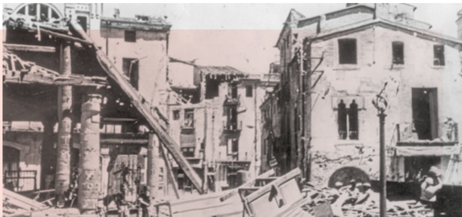
La Porxada derruïda pel bombardeig de 31 de maig de 1938

18.30 h | Parròquia de Sant Esteve Conferència. "De canvi climàtic a emergència climàtica" A càrrec de la meteoròloga Gemma Puig Org.: AGEVO