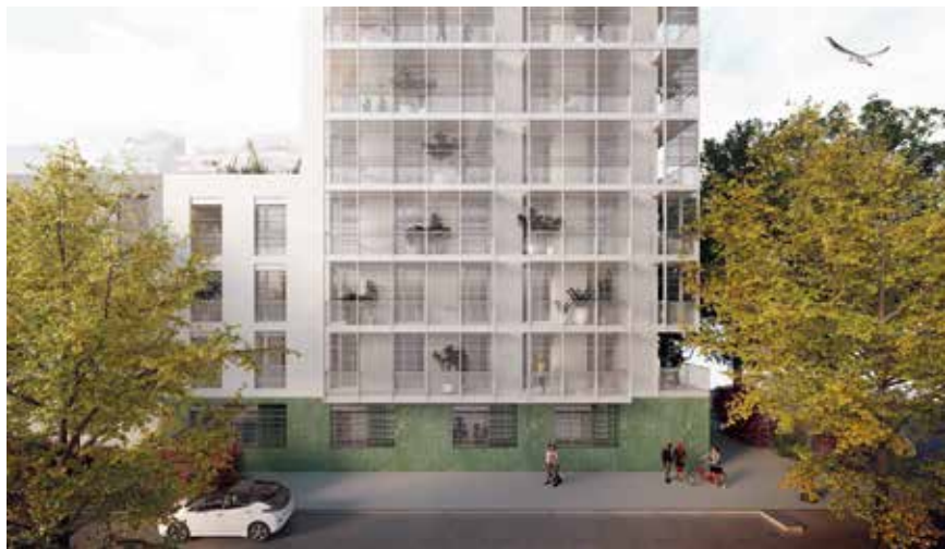
Imatge virtual de com quedarà el nou edifici d'habitatges de lloguer assequible situat al passeig de la Muntanya, 187

Han començat les obres de construcció d'un edifici de 17 habitatges de lloguer assequible, en el solar municipal situat al passeig de la Muntanya, 187, al barri de la Font Verda. Aquesta és una actuació prevista en el Programa d'Actuació Municipal i en el Pla Local de l'Habitatge, que promou l'Ajuntament per donar resposta a la necessitat d'habitatge assequible a la ciutat.