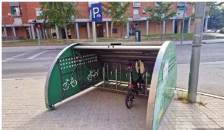
Aparcament segur gratuït a Can Mònic amb capacitat per a cinc bicicletes

La ciutat disposa d'11 nous aparcaments segurs per a bicicletes. Se sumen als 9 mòduls instal·lats des de 2021 i a l'aparcament tancat de l'estació de Granollers Centres amb capacitat per a