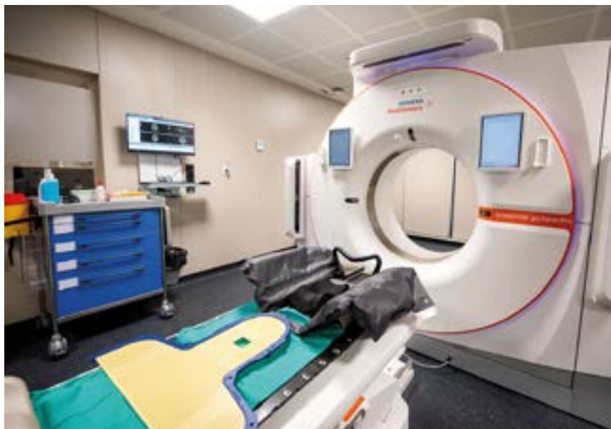
A dalt, la sala d'espera del centre té accés a les consultes i els vestidors i disposa de llum natural. A baix, el TAC d'última tecnologia per a la preparació i la planificació dels tractaments

i infraestructura sanitària pública i de qualitat. L'entrada en funcionament del nou centre també suposa l'inici del canvi estructural de model assistencial del Servei Català de la Salut i del mapa sanitari arreu del país. Un model en xarxa, basat en la coordinació i cooperació entre els hospitals, la qualitat de l'atenció i l'equitat per a tots els pacients. Així, l'experiència de l'eix de la C-17 es replicarà i articularà aquesta forma de col·laboració a altres punts del país, per oferir atenció de primer ordre i més proximitat.