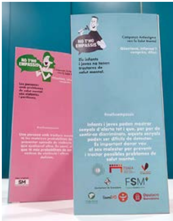
Als restaurants que participen en la campanya "No t'ho empassis", el mes d'octubre s'hi podrà trobar aquest material informatiu que busca desmentir prejudicis associats a la salut mental

El 10 d'octubre és el Dia Mundial de la Salut Mental 2023 que enguany té el lema 'La salut mental és un dret humà universal' amb l'objectiu que totes les persones rebin una atenció de salut mental de qualitat i que es respectin els drets humans i el benestar de les persones amb trastorns mentals.