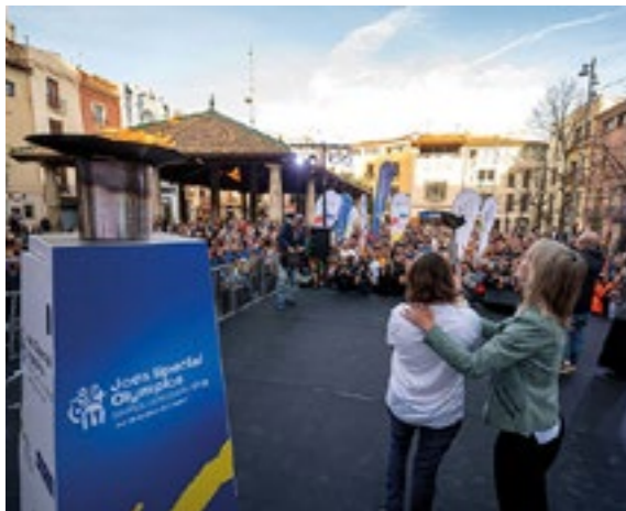
A la Porxada, encesa del peveter dels Jocs Special Olympics Granollers 2023