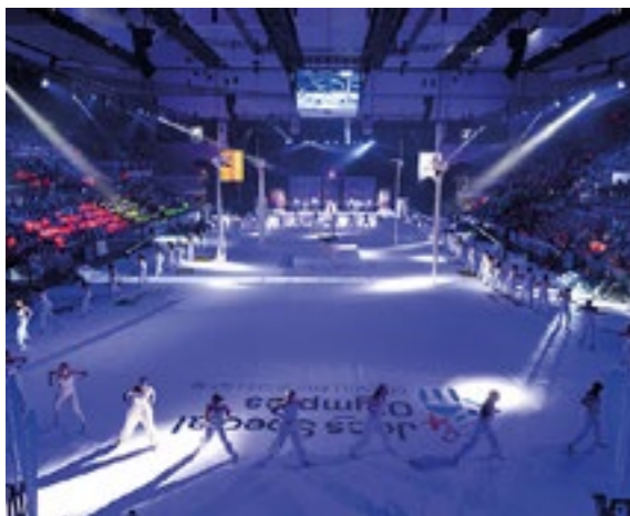
5.000 persones segueixen al Palau d'Esports, ple de gom a gom, la cerimònia inaugural dels Jocs