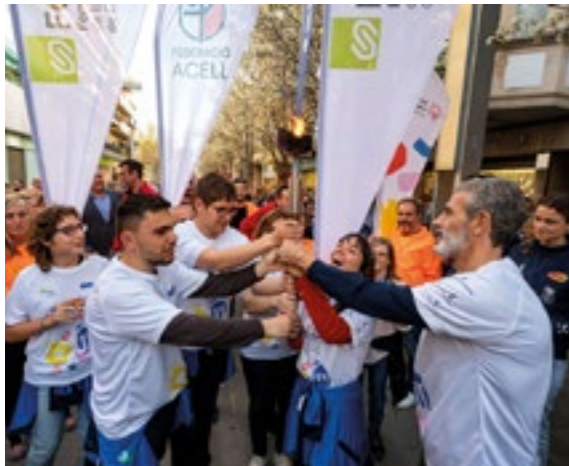
Emotiva rebuda de la torxa dels Jocs als carrers de la ciutat