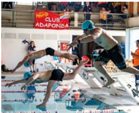
Les competicions esportives es van repartir en dues jornades. Els 1.800 esportistes van ser aplaudits i van rebre el reconeixement pel seu esforç i esportivitat