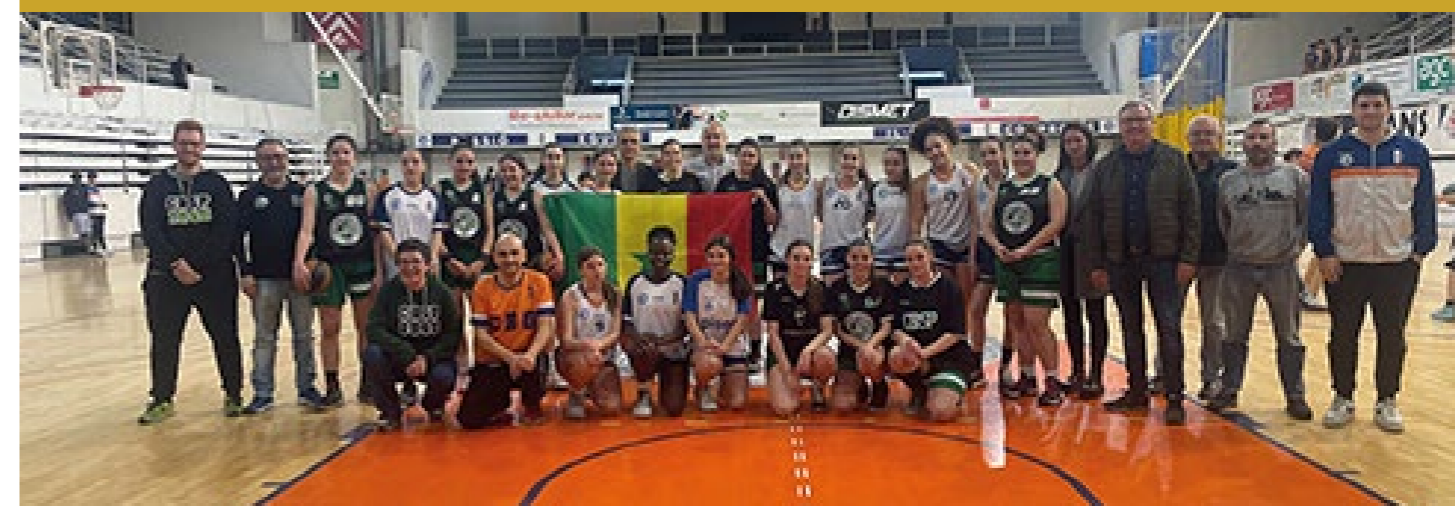
Al març, el Club Bàsquet Granollers va agafar el relleu d'aquest projecte del Club Bàsquet Santa Perpètua

L'Ajuntament dona suport al projecte “Esport i cooperació al Senegal” de l'Associació Catalana de Solidaritat i Cooperació Internacional pel Desenvolupament, ONGD AL KARIA, en el marc de l'impuls i acompanyament a projectes de cooperació que promouen l'enfortiment dels vincles amb la comunitat senegalesa. El Club Bàsquet Granollers treballarà en aquest projecte sorgit del Consell Municipal