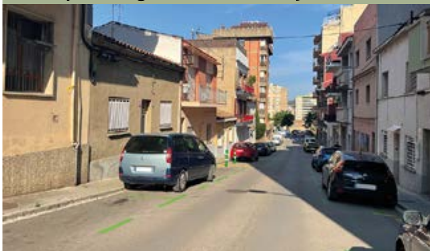
Nova àrea verda al carrer d'Ausiàs March

Ha entrat en funcionament l'ampliació de les àrees verdes de Primer de Maig i del passeig de la Muntanya. Des del 26 de juny, un centenar de places d'aparcament se sumen a les prop de 300 creades el febrer de 2022, amb l'objectiu d'afavorir les opcions d'aparcament del veïnat i fomentar la rotació de vehicles.