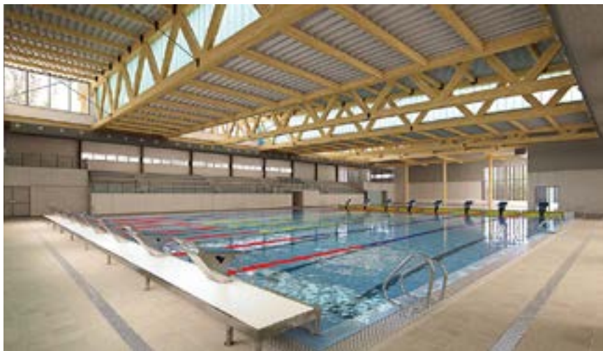
Imatge virtual de les instal·lacions de les piscines municipals reformades

Les obres de reforma i ampliació del complex de les piscines municipals es reprenen la segona quinzena del mes de juliol. L'actuació permetrà finalitzar la rehabilitació de l'edifici que,