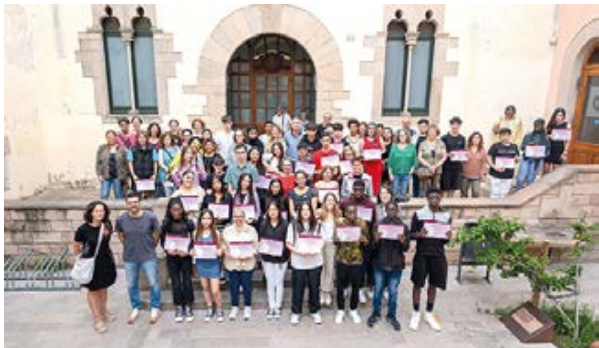
L'acte de cloenda fa un reconeixement als 62 alumnes que han format part de la 14a edició del Projecte Singular Junts

La 14a edició del Projecte Singular Junts tanca el curs amb un acte de cloenda que ha reconegut la implicació i la col·laboració de 68 empreses i 62 alumnes de set centres educatius de la ciutat,