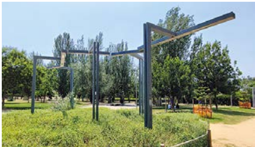
A l'esquerra, parc del Cogost. A la dreta, avinguda Sant Julià