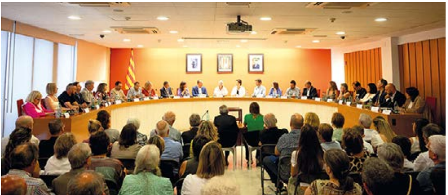
El plenari de l'Ajuntament de Granollers durant el ple d'investidura

representants municipals, 3 retornen a la corporació municipal, després de mandats sense formar-ne part, i 17 continuen del mandat anterior. El nou consistori és el dotzè que es constitueix des de la recuperació de la democràcia. El plenari de l'Ajuntament de Granollers està format per sis formacions polítiques: 13 regidors i regidores del PSC, 4 d'ERC, 3 de Junts per Granollers, 2 de Primàries, 2 del Partit Popular i 1 de Vox.