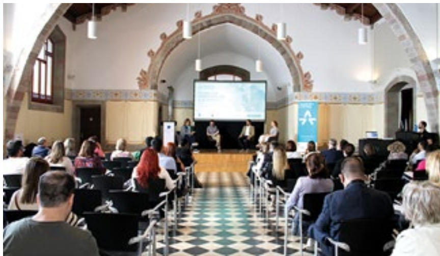
La jornada "FP Dual, una oportunitat per a les empreses" es va celebrar el passat 11 de maig a la Sala Tarafa

Aquest curs 2021-2022, 214 alumnes de la nostra ciutat han cursat FP Dual, una modalitat de formació professional que combina els processos d'ensenyament i d'aprenentatge al centre de formació i a l'empresa. A Granollers, els centres de formació professional desenvolupen FP Dual des del curs 2014-2015 i s'ha estès quasi a tots els cicles de grau superior i a la majoria de grau mitjà, sobretot als cicles industrials, però també als de serveis a les empreses com comerç, administratiu o informàtica.