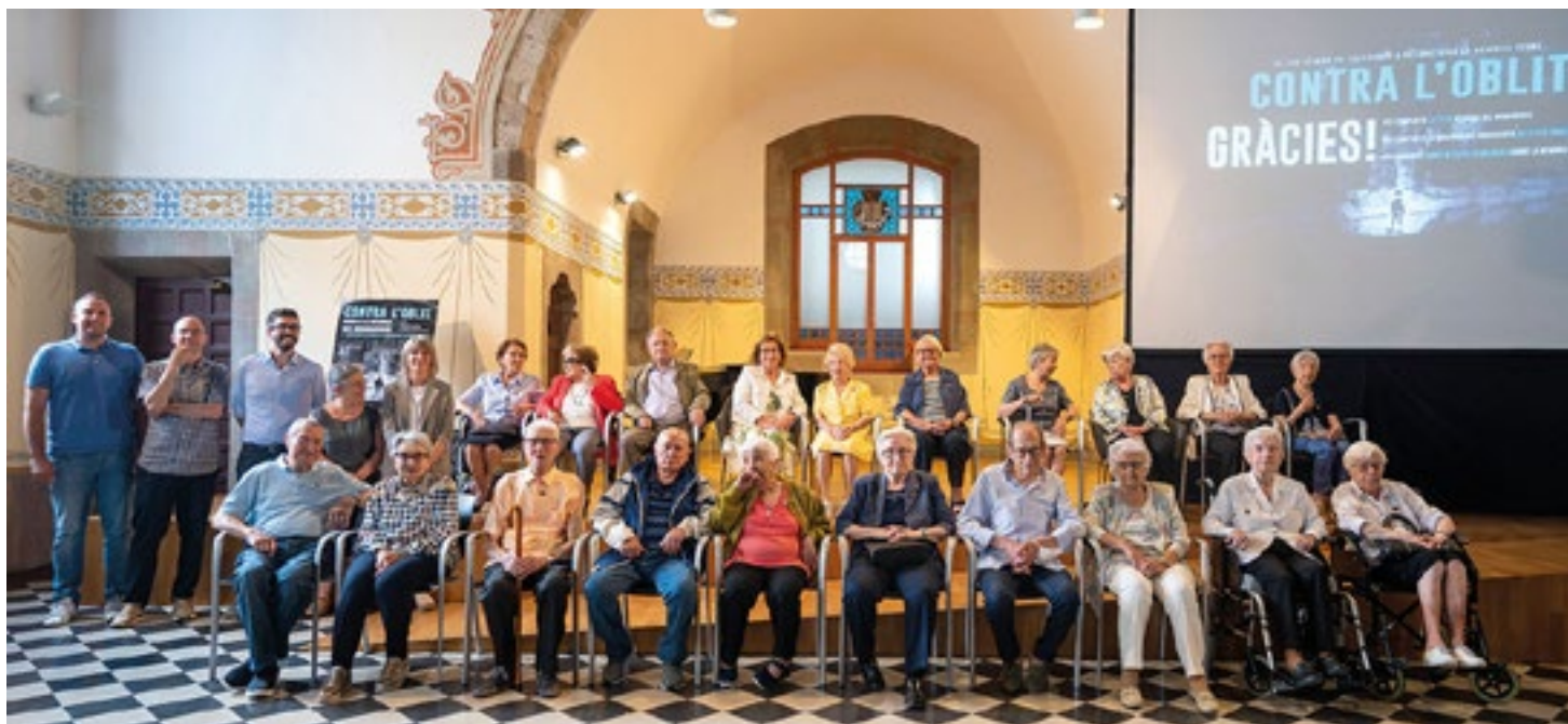
Una vintena de testimonis del bombardeig han participat a l'acte fet a la Sala Tarafa

El 30 de maig, poques hores abans del 84è aniversari del bombardeig de Granollers de 31 de maig de 1938, s'ha fet un acte d'agraïment a tots els testimonis que han compartit amb la ciutat la seva memòria d'aquells tràgics fets. Al llarg dels anys, l'Arxiu Municipal ha enregistrat els records de 55 persones, 18 de les quals s'han entrevistat aquest darrer any gràcies a la campanya "Contra l'oblit. Crida a la memòria del bombardeig".