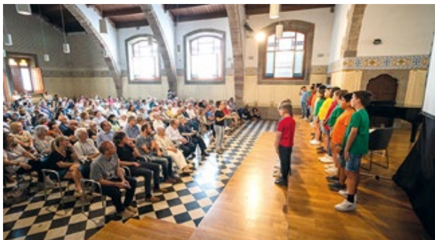
Alumnat de 4t i 5è de primària de l'escola Pereanton ha posat música a l'acte