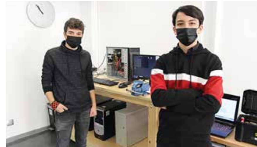
Dos alumnes de l'institut Carles Vallbona fan el sanejament del material informàtic