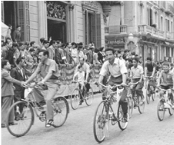
Celebració de la Diada del Club Ciclista, 1947.

Entre el 2 de març i el 10 de maig es pot visitar la nova exposició instal·lada a l'entrada de l'Ajuntament, titulada “Bicicletes en blanc i negre”. Una selecció de fotografies que mostra l'ús que els granollerins i granollerines feien de la bici, entre els anys 1910 i 1960: com a mitjà de transport en dies feiners, i també per a l'esbarjo i la pràctica esportiva. Les 14 imatges, signades per Albert Canet Botey, Ferran Salameró, Francesc Gorgui, Joan Guàrdia i Mercè de Buff, ens descobreixen una ciutat de carrers majoritàriament sense asfaltar i gairebé buits. Encara circulaven carros i la bicicleta era el mitjà de transport més utilitzat, sobretot entre la classe treballadora, mentre que els vehicles de motor eren escassos.