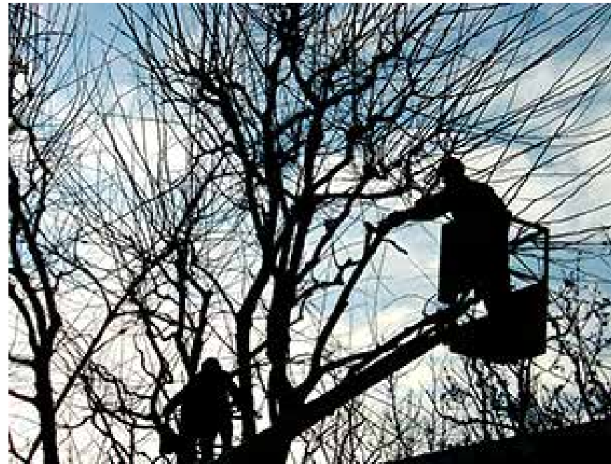
A Granollers es fa una revisió continuada dels arbres per garantir-ne la salut i la seguretat de la ciutadania

Els mesos de fred, normalment d'octubre a març, és la temporada de poda dels arbres. Des de fa més de 15 anys, a Granollers es fa una esporga respectuosa amb l'arbrat, duent a terme una mínima intervenció. Quan creixen amb llibertat, els arbres són més forts i sans. L'arboricultura és una tendència estesa a tot Europa. El creixement natural dels arbres comporta múltiples beneficis socials i mediambientals, afavoreix la biodiversitat i contribueix a l'embelliment del paisatge urbà, fent-lo més amable i agradable per a la ciutadania. Al contrari del que es creia fa molt de temps, són molts els avantatges de tenir arbres amb grans capçades, que actuen com a reguladors