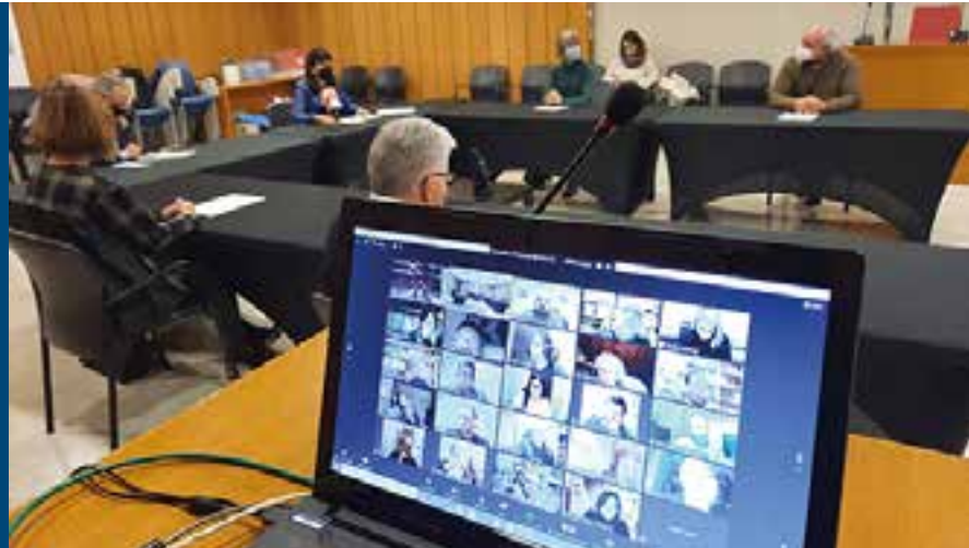
Presentació de les 40 mesures d'acció sorgides del Pacte de Ciutat

El 18 de febrer es van presentar públicament, i de forma virtual, les 40 mesures d'acció sorgides del procés participatiu del Pacte de Ciutat que s'han considerat òptimes per recuperar el dinamisme i la vitalitat de la ciutat arran de la Covid-19. Les actuacions de competència municipal que es desprenen d'aquestes mesures s'incorporen al Programa d'Actuació Municipal per impulsar-les, desenvolupar-les i fer-ne el seguiment.