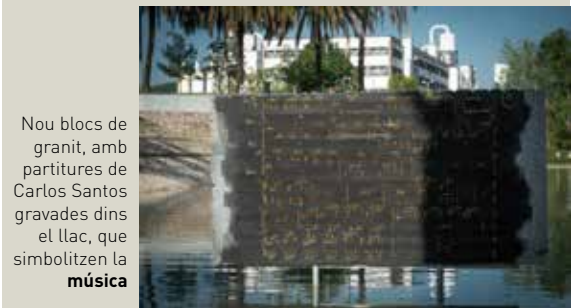
Nou blocs de granit, amb partitures de Carlos Santos gravades dins el llac, que simbolitzen la música