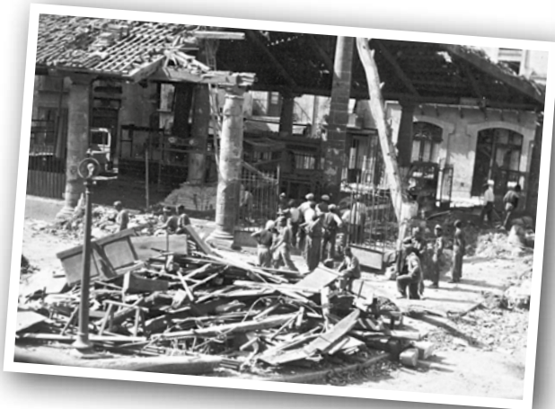
LA PORXADA VA PATIR AMB EL BOMBARDEIG DESPERFECTES EN L'ANGLE SUD-EST, JA QUE ES VA DESPLOMAR PART DE LA COBERTA AL PARTIR-SE DIVERSES COLUMNES.

La documentació dels arxius senyala com a objectius del bombardeig punts estratègics de comunicació com l'estació de ferrocarril de la línia del Nord, el pont sobre el riu Congost i el camp d'aviació de Llerona-la Garriga. També, els tallers de muntatge i reparació d'avions, així com les centrals elèctriques situades al carrer del Rec. Cap d'aquests objectius va ser tocat i les bombes van caure al centre de la població. El resultat va ser de centenars de morts, d'entre els quals se'n van registrar un mínim de 224, i la xifra de ferits greus va ser de 165. Els edificis sinistrats van ser més d'un centenar.