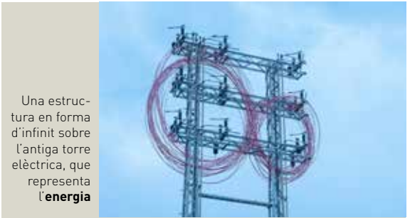
Una estructura en forma d'infinít sobre l'antiga torre elèctrica, que representa l'energia