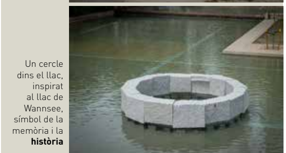
Un cercle dins el llac, inspirat al llac de Wannsee, símbol de la memòria i la història