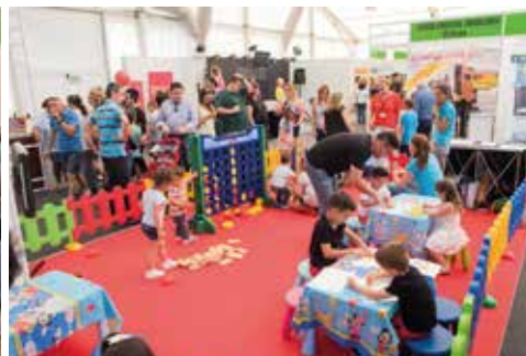
Imatges de l'Ascensió 2017.