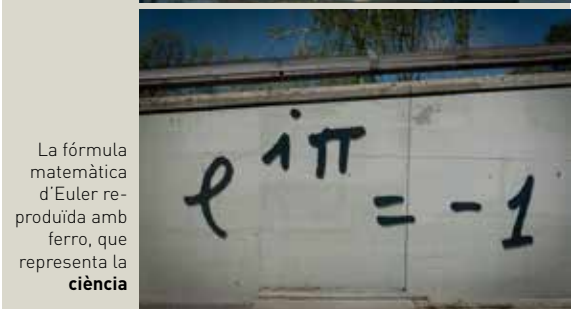
La fórmula matemàtica d'Euler reproduïda amb ferro, que representa la ciència