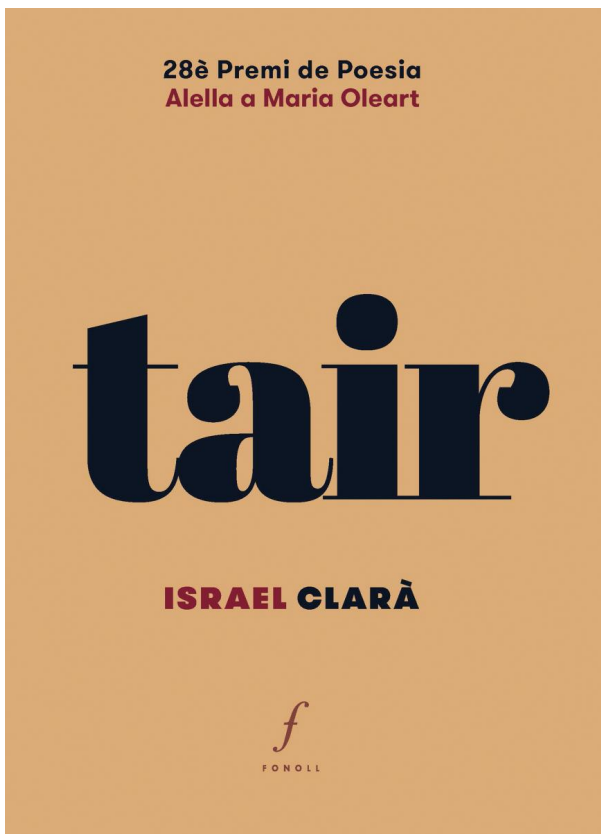
Tair , Israel Clarà

Aquest llibre és el resultat d'uns ulls que no volen deixar de veure. D'observar el món i les seves meravelles i volen, com aquells ocells de Fariddudín Attar, per les valls del coneixement i de la bellesa. Aquesta obra és un homenatge a la gran poesia en diverses llengües que ha pretès respondre la preocupació essencial de l'ésser humà: el seu lloc en l'univers i el motiu secret de l'existència.