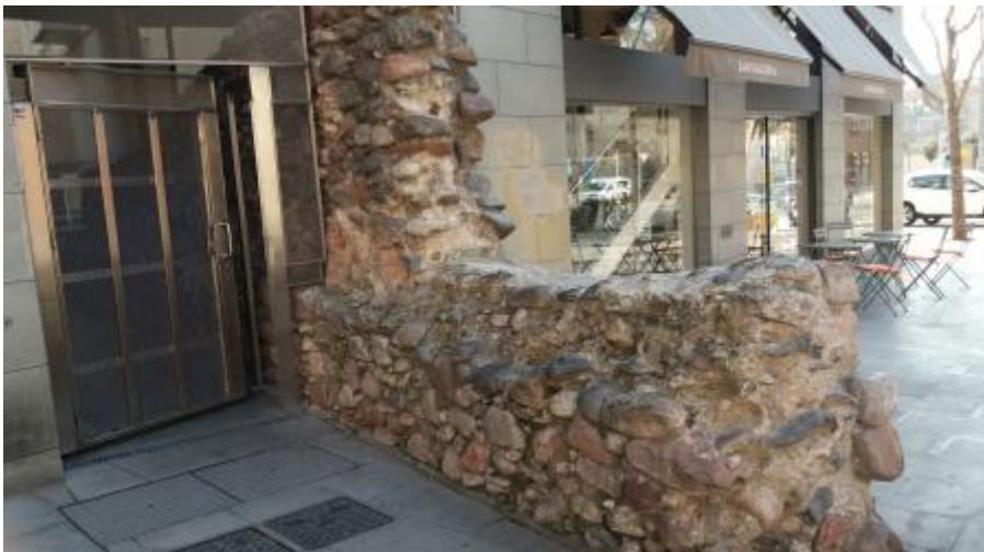
vors plaça de la