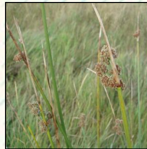
Foto 1.