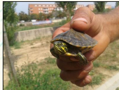
Foto 1. Foto 2. Tortuga juvenil en el passeig fluvial del riu Congost a Granollers

Hàbitat i ecologia: Habita en rius, basses, llacunes i estanys urbans.