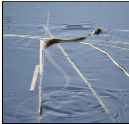
realitzades a l'aiguamoll de Can Cabanyes

Hàbitat i ecologia: Molt lligada a ambients aquàtics, tant naturals com artificials. S'alimenta de peixos i amfibis però també d'invertebrats i de micromamífers. El període de reproducció és primaveral, les cries neixen a mitjans d'agost.