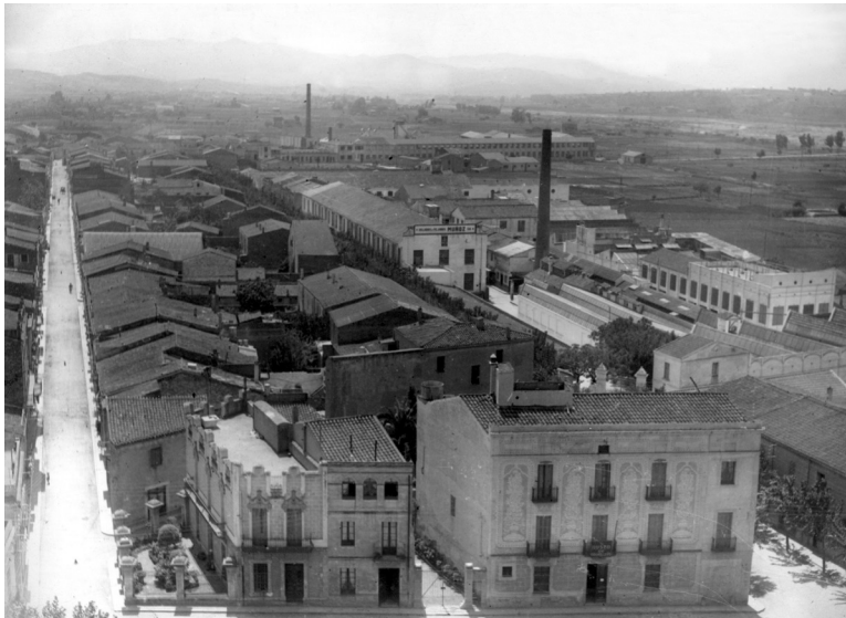
Vista panoràmica de Granollers des de l'església de Sant Esteve, amb la fàbrica de Can Comas a la dreta, l'any 1946.

L'any 1959 es crea el grup empresarial Unió Industrial Textil SA, Unitesa, fruit de la fusió de diverses empreses que integren el Grupo Muñoz i que seran absorbides per Sobrinos de Juan Batlló SA. Aquestes empreses, a part d'Hilados y Tejidos Comas SA, seran: Unió Industrial Algodonera SA, Fàbricas Muñoz SA, Algodonera del Pilar SA, Hilados Madurga SA i