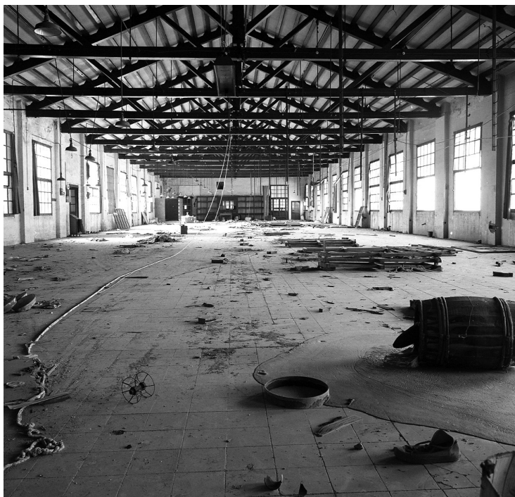
Interior d'una nau abandonada de la fàbrica de Can Comas, l'any 1986.

Ponències Revista del Centre d'Estudis de Granollers, 22 (2018), 163-177