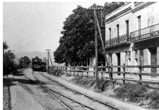
Vista del carrer de Girona, anys 30.