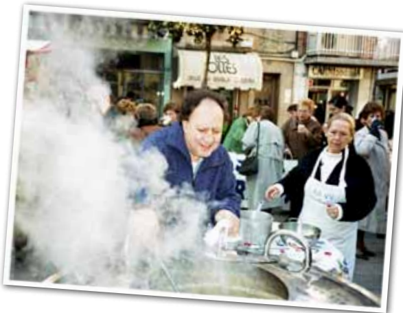
INAUGURACIÓ DEL MONUMENT A L'OLLA EL DIA 15 DE DESEMBRE DE 2000.