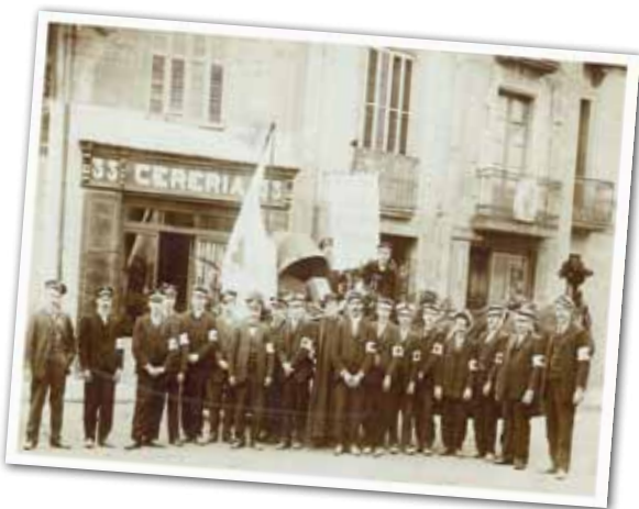
INTEGRANTS DE LA CREU ROJA DE GRANOLLERS AMB UN GRUP DE REPRESENTANTS DE LA CREU ROJA SICILIANA, 1916.

Aquest mes de setembre es compleixen 110 anys de la fundació de l'Assemblea Local de Creu Roja Granollers. Avui continua prestant un servei essencial. Una de les prioritats d'aquesta institució humanitària ha estat donar continuïtat aquest estiu a l'ajuda alimentària per als infants més vulnerables, a partir d'un programa coordinat amb l'Ajuntament de Granollers.