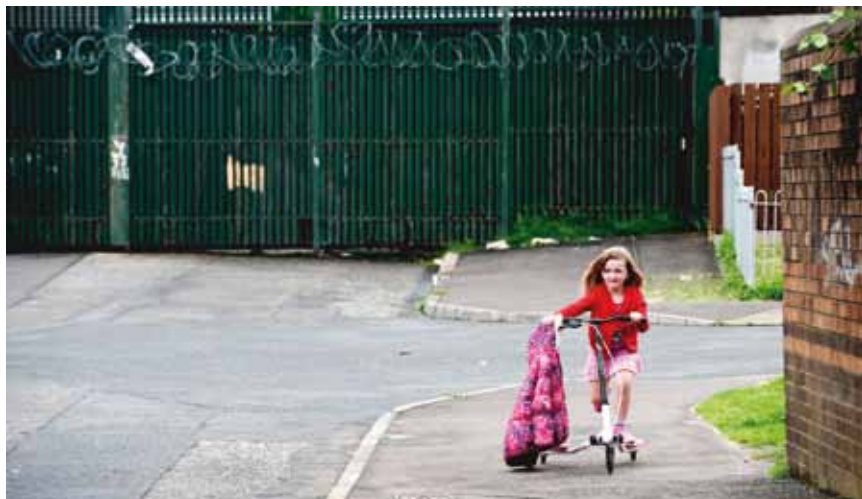
Imatge de Belfast (Irlanda del Nord), una de les ciutats presents a l'exposició de l'Institut Català Internacional per la Pau (ICIP).