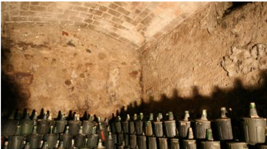
actualment forma part de